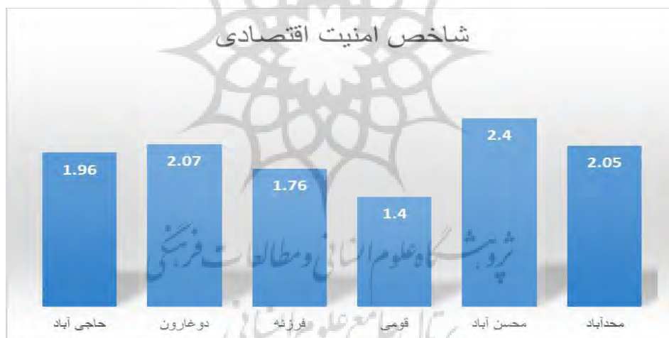
شکل ۲- نتایج سنجش شاخص امنیت اقتصادی به تفکیک روستا

در ادامه ارزیابی شاخص امنیت اقتصادی طبق داده های بدست آمده و شکل شماره ۲ روستای قومی با میانگین ۱.۴ کمترین و روستای محسن آباد با میانگین ۲.۴ بیشترین میانگین شاخص اقتصادی را داشته است همچنین روستاهای دوقارون با میانگین ۲.۰۷ و محمد آباد با میانگین ۲.۰۵ و حاجی آباد با میانگین ۱.۹۸ و فرزانه با میانگین ۱.۷۶ بوده است