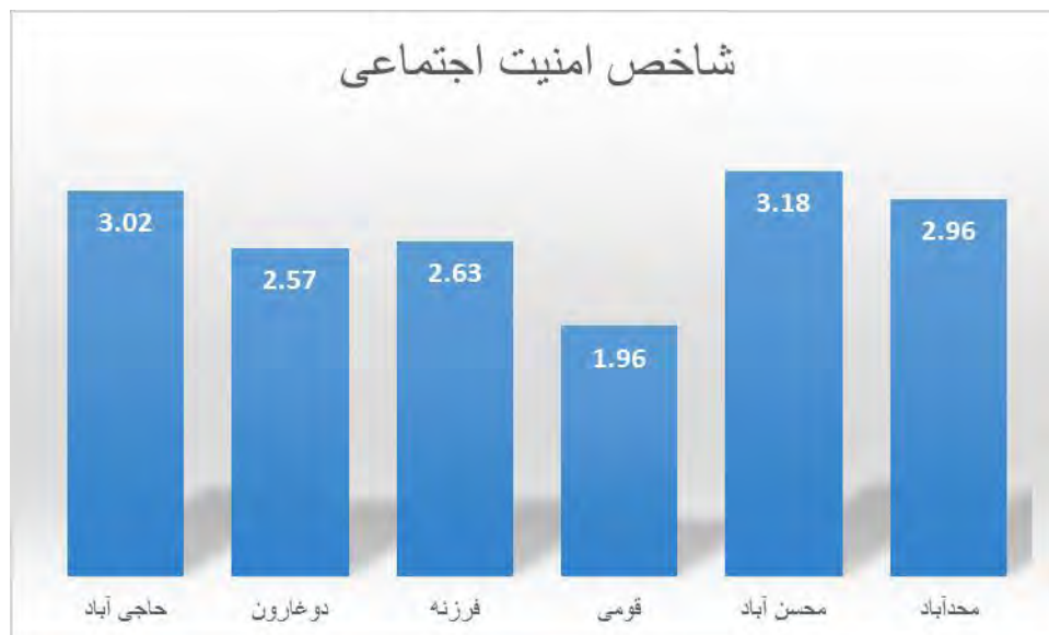
شکل ۳- نتایج سنجش شاخص های امنیت اجتماعی به تفکیک روستا

همچنین برای سنجش تفاوت میانگین ها از آمار استنباطی و آزمون T تک نمونه ای و مقدار P-Value استفاده شده است که با توجه به جدول شماره ۷ و مقدار P-Value و در شاخص امنیت اقتصادی برابر با صفر بوده و کمتر از ۰.۰۵ میباشد بنابراین فرضیه میزان رضایت امنیت اقتصادی بیشتر از متوسط است رد شده و در شاخص امنیت اجتماعی مقدار P-Value برابر با ۰.۰۰۱ بوده و کمتر از ۰.۰۵ می باشد همچنین با توجه به میانگین شاخص که برابر با ۲.۷۹ بوده بنابراین فرضیه میزان رضایت امنیت اجتماعی بیشتر از متوسط است رد شده.