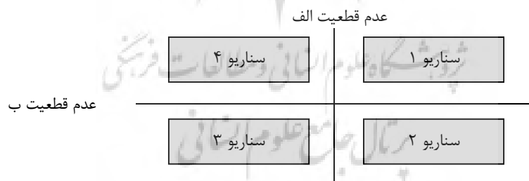
شکل ۱ سناریونویسی با استفاده از رویکرد ماتریسی با چهار سناریو و دو عدم قطعیت [۱۵]

روش انجام تحقیق با توجه به کیفی و آینده‌نگرانه بودن آن، روش سناریونویسی با رویکرد GBN ۱۳ و استفاده از مدل استنتاجی (یا ماتریسی) انتخاب شده است. در حال حاضر روش‌های مبتنی بر عدم قطعیت و خصوصاً روش GBN رایج‌ترین و کاربردی‌ترین روش ساخت سناریوها به شمار می‌رود [۱۴]. در این مدل با تعیین دو (یا سه) عدم قطعیت اصلی، فضای سناریوها در قالب ماتریسی متشکل از دو محور اصلی از دو سر عدم قطعیت‌های یادشده تشکیل و فضاهای چهارگانه‌ای در قالب یک ماتریس ۲ در ۲ برای ترسیم امکان‌های آینده تصویر می‌شود.