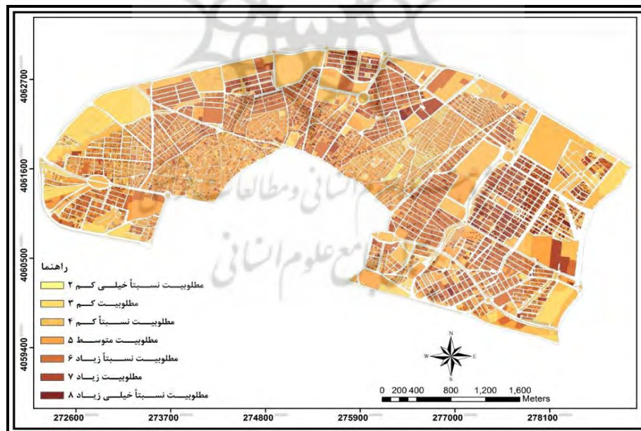
شکل ۲- نقشه‌ی میزان مطلوبیت ابعاد کالبدی - فضایی کیفیت محیط شهری در بافت میانی شهر زنجان