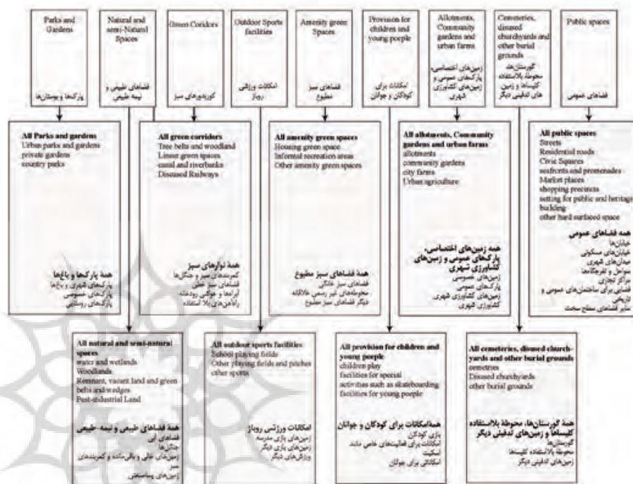
نمودار ۱. دسته بندی فضاهای باز و زیرمجموعه های آن، مأخذ: Bell, Montarziou & Travlou, 2006 Diagram 1. Grouping open spaces and subsets of them, Source: Bell, Montarziou & Travlou, 2006.