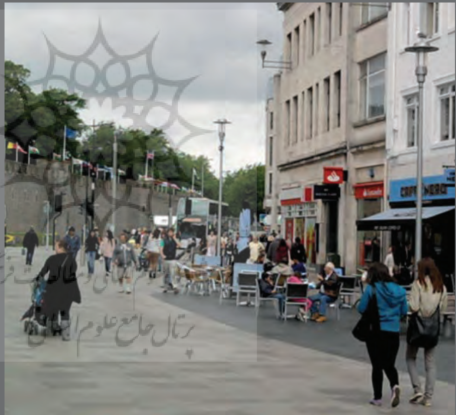
تصویر ۳ Pic3

تصویر ۳ : خیابان های پیاده‌پسند محلی برای مکث و تعاملات اجتماعی است، کاردیف، ولز، عکس : امید ریسمان چیان، ۱۳۸۹.