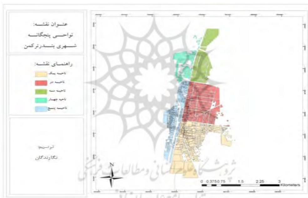
شکل ۲- تقسیم‌بندی نواحی پنج‌گانه شهر بندرترکمن

بنیاد و برپایی این شهر به دستور رضاخان صورت گرفته بود، تا قبل از پیروزی انقلاب اسلامی بندرشاه نامیده می‌شد و بعد از آن، طی تصویب نامه شماره ۵۵۲۷۴ مورخ ۱۳۵۸/۶/۲ دفتر تقسیمات کشوری وزارت کشور به بندرترکمن تغییر نام یافت (شفقی، ضرابی، و بردی، آنامردنژاد، ۱۳۸۳، صص. ۹-۱۱) و امروزه نیز به‌عنوان مرکز شهرستان با جمعیت ۴۷۲۱۳ نفر، چهارمین شهر استان گلستان است. براساس مطالعات طرح جامع، شهر بندرترکمن به پنج ناحیه تقریباً همگن تقسیم گردیده است که ارزیابی و اولویت‌بندی پایداری اجتماعی در این مقاله، در داخل نواحی پنجگانه فوق انجام شده است (شکل ۳):