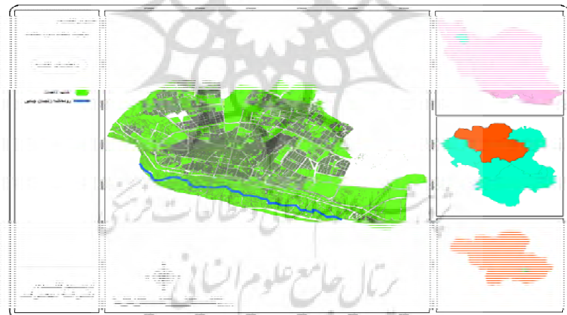
شکل ۱- نقشه موقعیت منطقه مورد مطالعه

برای ارزیابی ساختار زیست محیطی شهر زنجان علاوه بر معیارها و شاخص‌های کمی از یک سری شاخص کیفی برای تحلیل بهتر موضوع استفاده شده است، و سپس برای وزن دهی شاخص‌ها، پرسشنامه‌هایی تهیه شد. در واقع برای شناخت دقیق