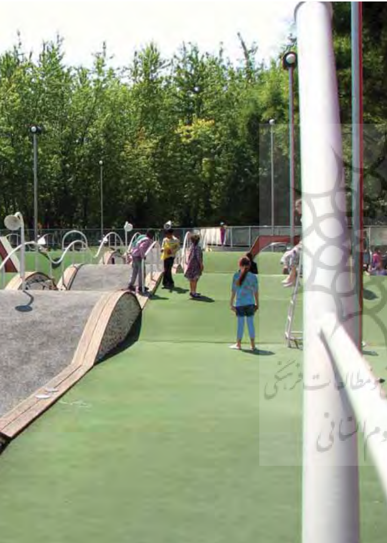
تصویر ۱: فضای بازی کودکان در شهر، فرصتی برای کسب تجربه‌های اجتماعی و افزایش خلاقیت در آنها، عکس: رسول رفعت، ۱۳۹۰.