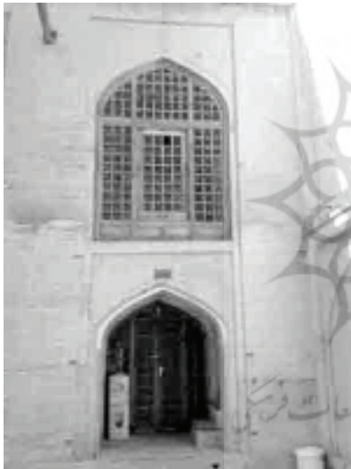
تصویر شماره (۲): نمای خارجی خانه خواجه پطرس