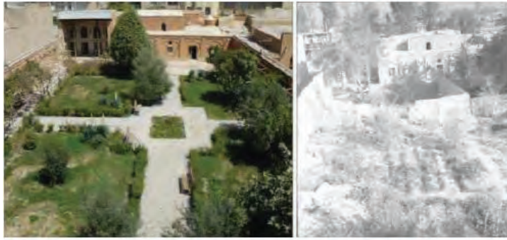
تصویر شماره (۴): نمای خانه سوکیاس قبل و بعد از تغییر کاربری