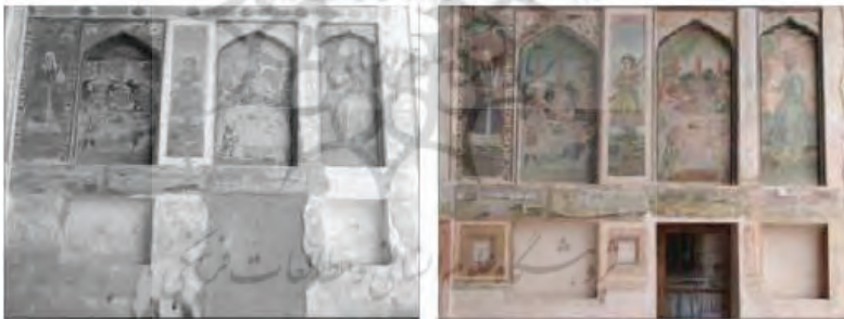
تصویر شماره (۶): نقاشی‌های ایوان ورودی جبهه شمالی خانه سوکیاس قبل و بعد از تغییر کاربری

مهمانان خارجی و سیاستمداران، استفاده از هنرمندان اروپایی، صرف هزینه برای تزئینات گوناگون و معماری ویژه این خانه‌ها همگی نشان‌گر فرهنگ ویژه ساکنان آن یعنی ارمنه دوره صفویه است که باعث ایجاد یک منطقه ویژه و تفاوت‌هایی با خانه‌های مسلمانان در آن زمان شده است.