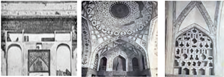
تصویر شماره (۳): چند نما از خانه خواجه پطرس (نمای داخلی)

دارد و خصوصیت بارزش آن وجود هسته مرکزی به ارتفاع دو طبقه است. این هسته شامل ایوانی ستون دار به همراه تالار یا حوض خانه‌ای با پلان صلیبی شکل و محاط در یک چهارگوش با سقف گنبدی به ارتفاع دو طبقه است.