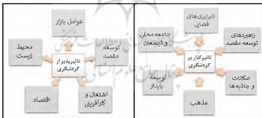
تصویر ۲- متغیرهای تأثیرگذار بر گردشگری و تأثیرپذیر از گردشگری

در بررسی ابعاد ارزیابی شده مقالات مشخص شد (تصویر ۲) که بیشترین فراوانی به ترتیب مربوط به توسعه گردشگری با ۱۸ مقاله (۲۶٪)، رویکردهای برنامه‌ریزی با ۱۰ مقاله (۱۵٪)، اثرات گردشگری با ۸ مقاله (۱۲٪)، ارزیابی و انتخاب مقصد و نیز رفتار جامعه محلی و گردشگر هرکدام با ۷ مقاله (۱۰٪)، جاذبه‌های گردشگری با ۴ مقاله (۶٪)، مکان‌یابی و پتانسیل سنجی با ۳ مقاله (۴/۵٪) و توسعه مقصد با ۲ مقاله (۳٪) بوده است؛ همچنین اقلیم مقصد، برندسازی مقاصد گردشگری، ایمنی امنیت و محیط‌زیست نیز هرکدام ۱ مقاله را به خود اختصاص داده‌اند؛ عمده متغیرهای مؤثر بر گردشگری و تأثیرپذیر از گردشگری در تصویر ۲ قابل مشاهده‌اند.