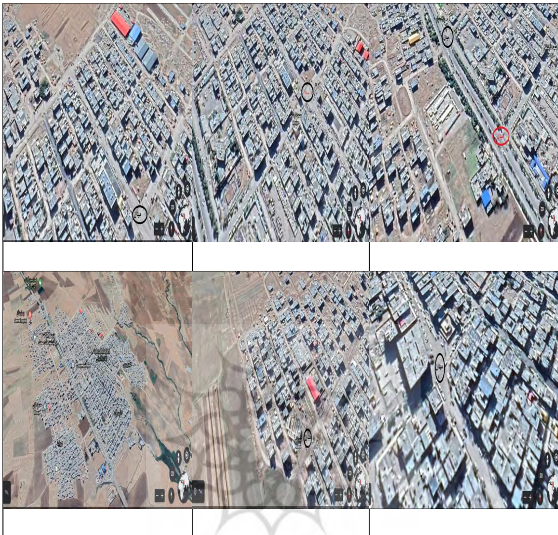
۶ میدان های پیشنهادی شهر تازه آباد ثلاث

پژوهشگاه علوم انسانی و مطالعات فرهنگی پرتال جامع علوم انسانی