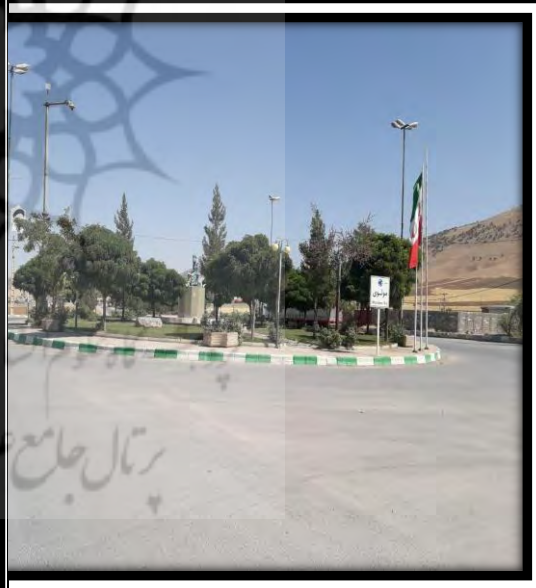
شماره (۴) میدان معلم