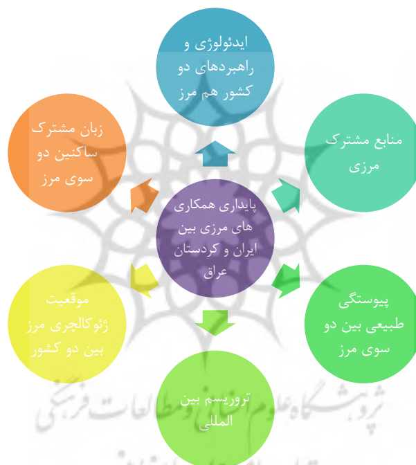
شکل ۲: مهم‌ترین عوامل مؤثر در پایداری همکاری مرزی بین ایران و کردستان عراق

سبب شده، بنابراین همکاری بیشتر با این منطقه می‌تواند به‌عنوان یکی از راهکارهای تضمین امنیت و توسعه در مناطق مرزی غرب کشور به‌ویژه مناطق کردنشین باشد. بر همین اساس مقاله حاضر با رویکردی توصیفی تحلیلی و با هدف بررسی عوامل مؤثر بر تداوم همکاری‌های مرزی انجام گرفته است. بدین منظور نگارندگان با مراجعه به منابع مختلف ۱۸ متغیر را به‌عنوان عوامل مؤثر در همکاری مرزی بین کشورها مشخص نمود و در ادامه به‌منظور بررسی این موارد بر منطقه مورد مطالعه در اختیار جامعه آماری تحقیق قرار گرفت. یافته‌های میدانی تحقیق حاضر که برگرفته از نظرات نخبگان و کارشناسان مرتبط با مسائل مرزی بود نشان داد که ۶ متغیر پیوستگی طبیعی مرز بین دو کشور، ایدئولوژی‌ها و راهبردهای دو کشور هم‌مرز، زبان مشترک ساکنین دو سوی مرز، منابع مشترک مرزی، تروریسم بین‌المللی و موقعیت ژئوکالچری مرز بین دو کشور از جمله مهم‌ترین متغیرهای تأثیرگذار بر پایداری همکاری‌های مرزی بین منطقه خودمختار کردستان عراق و ایران محسوب می‌شوند.