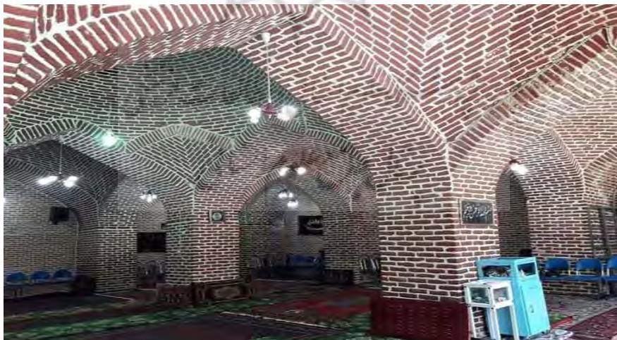
تصویر (۲): جاهای دیدنی میاندوآب آذربایجان غربی

مسجد طاق: مسجد طاق در کوچه طاق، خیابان ۱۷ شهریور شهر میاندوآب واقع شده است. این مسجد زیبا متعلق به اواسط دوره قاجار است و به نظر می رسد در فاصله بین سال های ۱۲۰۰ تا ۱۲۱۰ ه.ق ساخته شده که در این بین سال ۱۲۰۲ محتمل تر است. سازنده بنا حاکم مراغه، احمدخان بیگلر بیگی، بوده که پیوند خویشاوندی نزدیکی با فتحعلی شاه قاجار داشته است. مسجد طاق که قدیمی ترین مسجد شهر میاندوآب است ترکیبی از سنگ، آجر و خشت است و آجرهای قرمز رنگ آن جلوه خاصی به بنا داده اند.