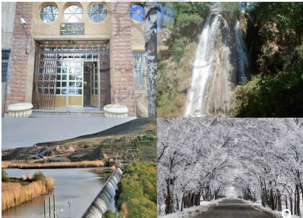
تصویر (۳): تصاویری از جاذبه های گردشگری شهرستان میاندوآب

سد نوروزلو: سد نوروزلو در سال ۱۳۴۶ در نزدیکی روستای نوروزلو بر روی رودخانه زرینه رود ساخته گردیده است. اما این سد به علت قرارگرفتن تالاب زیبای نوروزلو در محدوده آن جلوه بسیار زیبایی دارد. سد که در ۱۵ کیلومتری میاندوآب قرار گرفته از طریق جاده میاندوآب به شاهین دژ قابل دسترسی است. تالاب نوروزلو با داشتن جنگلی انبوه از درختان کوتاه گز، سرو و نیزارهای زیبا محل زندگی پرندگان بومی و مهاجر است. سد و تالاب نوروزلو یکی از تفرجگاه های زیبای شهر میاندوآب است.