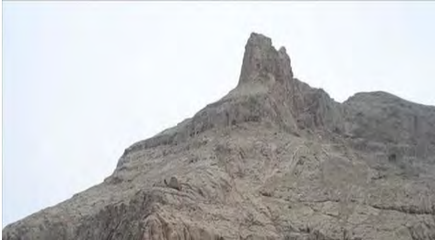
تصویر (۱): جاهای دیدنی میاندوآب آذربایجان غربی

مسجد طاق: مسجد طاق در کوچه طاق، خیابان ۱۷ شهریور شهر میاندوآب واقع شده است. این مسجد زیبا متعلق به اواسط دوره قاجار است و به نظر می رسد در فاصله بین سال های ۱۲۰۰ تا ۱۲۱۰ ه.ق ساخته شده که در این بین سال ۱۲۰۲ محتمل تر است. سازنده بنا حاکم مراغه، احمدخان بیگلر بیگی، بوده که پیوند خویشاوندی نزدیکی با فتحعلی شاه قاجار داشته است. مسجد طاق که قدیمی ترین مسجد شهر میاندوآب است ترکیبی از سنگ، آجر و خشت است و آجرهای قرمز رنگ آن جلوه خاصی به بنا داده اند.