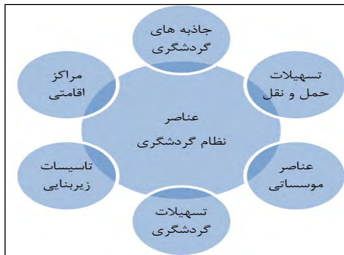
نمودار ۱. عناصر نظام گردشگری (اینسکیپ، ۱۳۹۱)