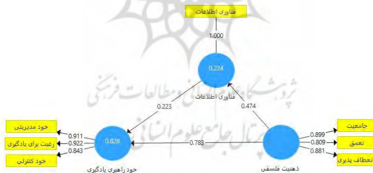
شکل ۱- مدل معادلات ساختاری در حالت استاندارد

برای آزمون فرضیه پژوهش از مدل معادلات ساختاری جهت بررسی روابط بین متغیرهای نهفته درونی و بیرونی استفاده شده است. در اینجا هدف، تشخیص این موضوع است که آیا روابط تئوریکی بین متغیرها در مرحله تدوین چارچوب مفهومی مد نظر، محقق بوده است.