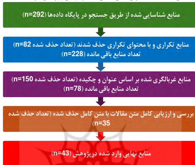
شکل ۱. نمودار جریان شناسایی و گزینش مطالعات مطابق با دستورالعمل‌های بیانیه PRISMA

در نهایت، فرآیند شناسایی و انتخاب منابع این پژوهش مطابق با چارچوب PRISMA و در چند مرحله انجام شد. در گام نخست، تعداد ۲۹۲ منبع علمی از طریق پایگاه‌های اطلاعاتی شناسایی شد. پس از حذف ۸۲ مورد تکراری، تعداد ۲۲۸ منبع برای غربالگری اولیه باقی ماند. در مرحله غربالگری عنوان و چکیده، به دلیل عدم ارتباط محتوایی، ۱۵۰ مطالعه کنار گذاشته شد و ۷۸ منبع وارد مرحله ارزیابی تمام‌متن شدند. سپس با بررسی دقیق متن کامل مقالات و اعمال معیارهای ورود و خروج، ۳۵ منبع به دلیل عدم انطباق با معیارهای تعیین شده حذف شد. در نهایت، ۴۳ مطالعه واجد شرایط شناسایی شدند که به‌عنوان منابع اصلی تحلیل نهایی پژوهش مورد استفاده قرار گرفتند (شکل ۱).