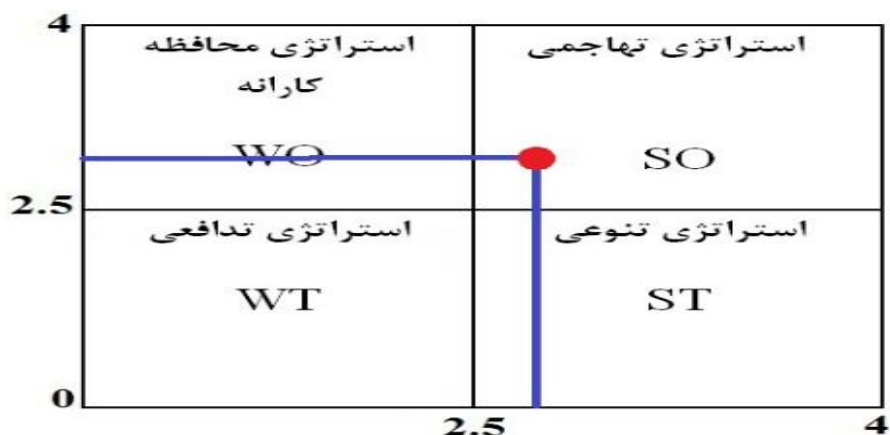
Figure 2: Result of internal and external matrix evaluation of Khodaqoli village

نماید. هر سیستمی علاقمند است که همیشه در این موقعیت قرار داشته باشد تا بتواند با بهره‌گیری از نقاط قوت داخلی از فرصت‌ها و رویدادهای خارجی حداکثر استفاده را بنماید.