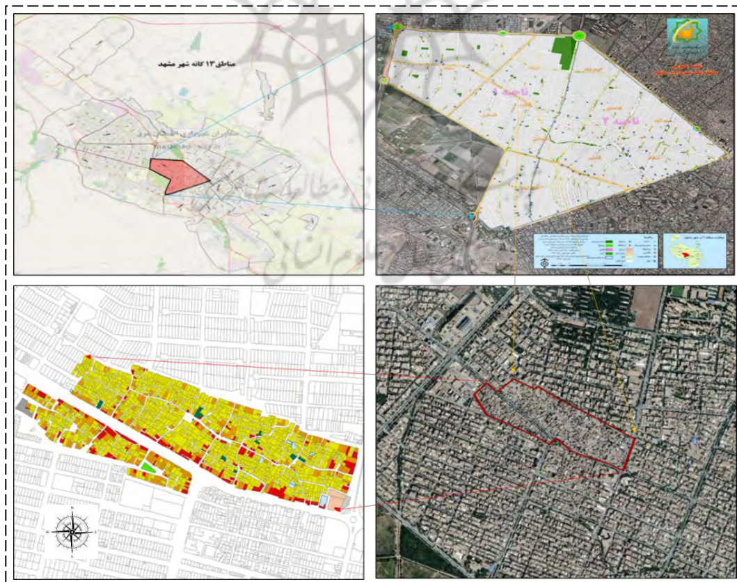
شکل ۱: موقعیت محله آبکوه در شهر مشهد

محله آبکوه در ناحیه ۱ از منطقه ۱ شهر مشهد و در فاصله حدود ۷ کیلومتری غرب حرم مطهر امام‌رضا (ع) به‌عنوان بافتی بسیار متراکم، فرسوده، ارگانیک و نامتجانس با بافت‌های همجوار خود از حیث خصوصیات اجتماعی، فرهنگی، اقتصادی و کالبدی قرار گرفته است. این محله از شمال به خیابان آپادانا و هجرت، از جنوب به بلوار دستغیب و خیابان فلسطین و از شرق به بلوار شهید صادقی (سازمان آب) محدود شده است (شکل ۱). همچنین محورهای شریانی درجه ۲ واقع در اطراف محله آبکوه، ارتباط میان این محله و میدان‌های مهم شهری همچون؛ میدان شهدا، میدان فردوسی، میدان ملک‌آباد و غیره و کانون‌های سفر را برقرار نموده است.