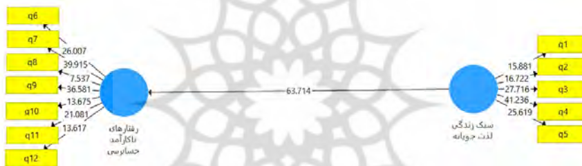
شکل ۲- مقادیر آماره t - ضرایب معناداری.

در شکل ۱ مستطیل‌های زرد، سوال‌های پرسشنامه پژوهش می‌باشد که به وسیله این سوال‌های متغیرهای مکنون یا پنهان پژوهش را اندازه‌گیری می‌کنیم. دایره‌های آبی رنگ متغیرهای پژوهش می‌باشد. اعدادی که روی فلش‌های کشیده شده از دایره‌های آبی رنگ به مستطیل‌ها یا سوال‌های پژوهش نوشته شده است. در نهایت اعدادی که بین دایره‌های آبی رنگ روی فلش نوشته شده است همان ضرایب مسیر متغیرهای پژوهش می‌باشد و مشخص می‌کند میزان تاثیرگذاری هر یک از متغیرهای پژوهش بر همدیگر چقدر است. بر اساس مطالعات گوناگون مقادیر مختلفی را برای تایید حداقل بار عاملی قابل قبول ذکر گردیده است. کلاین و همکاران [26] مقدار قابل قبول بار عاملی را برای تایید روایی پرسشنامه ۰/۴ عنوان نموده است که ملاک این پژوهش نیز همین مقدار بوده است. شکل ۱ ضرایب مسیر، نشان‌دهنده میزان تاثیر متغیر مستقل بر متغیر وابسته است. ضریب مسیر به شرطی قابل قبول است که آماره مربوط در رابطه مورد نظر معنی دار باشد. بر این اساس هرچه قدر مطلق مقدار ضریب مسیر بزرگ‌تر باشد نشان‌دهنده اثر بیشتر آن خواهد بود و علامت مقدار ضریب مسیر بازگوکننده نوع اثرگذاری (مستقیم یا معکوس) است.