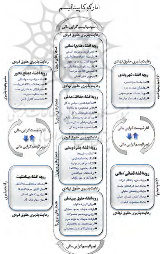
شکل (۷) الگوی نهایی تسهیل رویه‌های افشای اطلاعات بر اساس مضامین زمینه‌های نظریه

اثرگذار نظریه‌هایی مثل آنارکوکاپیتالیسم که بر اعتلای منافع برابر در یک نظام اقتصادی ناکارآمد تأکید دارد، به سمت تقارن‌پذیری بالاتر و نظام جریان آزاد اطلاعات حرکت نماید؛ لذا با ارائه مقدمه‌ای در خصوص ماهیت این مطالعه به لحاظ اهمیت، می‌توان بر اساس ماهیت پدیدارشناسی مبتنی بر تکنیک نقاط مرجع استراتژیک به طی فرایندهای انجام مصاحبه، کدگذاری باز، مضمونیابی گزاره‌ای و پدیداری مقوله‌هایی مبتنی بر تقاطع‌های ماتریسی در الگوی نهایی نقاط مرجع استراتژیک اشاره نمود که در قالب شکل (۷) زمینه را برای تناسب بهتر ادراک ترکیب زمینه‌های نظریه آنارکوکاپیتالیسم با رویه‌های کارآمدتر افشای اطلاعات شرکت‌ها ایجاد نماید.