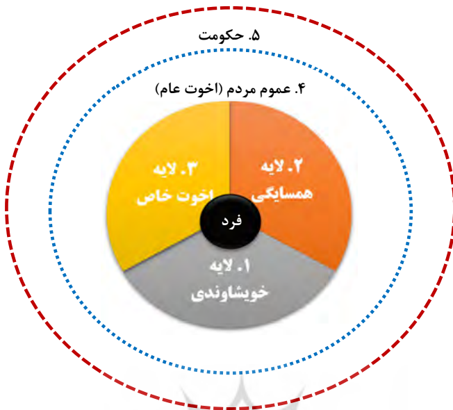
شکل ۲: لایه‌های حمایت از فرد در راهبرد تضمین