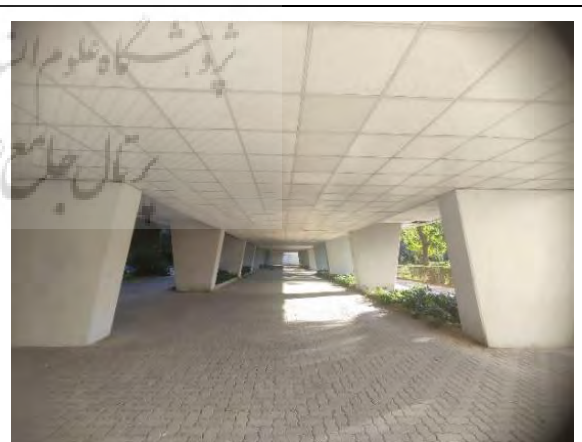
تصویر ۳: فضاهای پیلوتی (زیربلوکی)، مأخذ: نگارندگان

جدول ۱: نظریات پیرامون معنا و سازوکارهای تولید آن در انسان، مأخذ: نگارندگان.