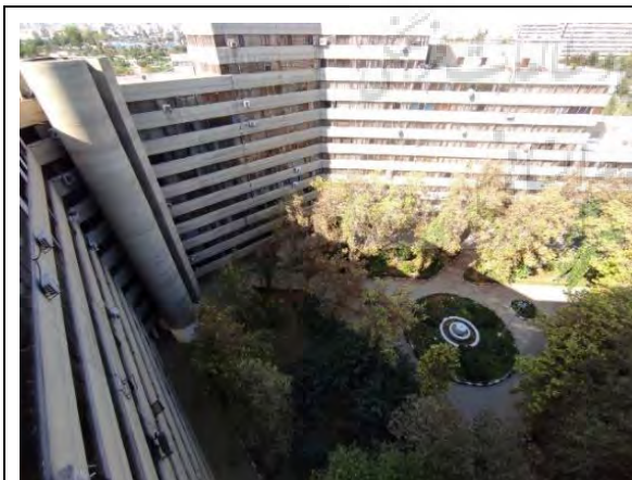
تصویر ۴: فضاهای میان بلوکی، مأخذ: نگارندگان.

ساختمان و شهر در درجه اول بر مبنای پاسخ به خواست کارفرمایان و دیدگاه طراحان تعریف و طراحی شده و شکل کلی آن‌ها در زمان ساخت مشخص می‌گردد. باین‌حال، معنابخشی به این فضاها غالباً فرایندی متفاوت را طی می‌کند. از لحظه‌ی حضور انسان در فضا، فرآیند تولید معنا آغاز می‌شود و لایه‌های معنایی متنوعی به‌طور فردی و جمعی توسط افراد مختلف در یک روند پیوسته و تاریخی شکل می‌گیرد. [۲۸-۳۲] فهم این ساختار پیچیده معانی تولیدشده از طریق خوانش تفسیری ممکن شده تا در هر زمان وجوه مختلفی از این معانی روشن گردد. مخاطب و شهروند در مواجهه‌ای متفاوت با عناصر عینی قرار می‌گیرند تا در فرآیندی ذهنی و از طریق تجربه زیسته، زبان، تعاملات اجتماعی، حافظه، و رفتار انسانی، ساخت نظم معنایی و به دنبال آن فضای اجتماعی ممکن گردد. [۳۳] بخش