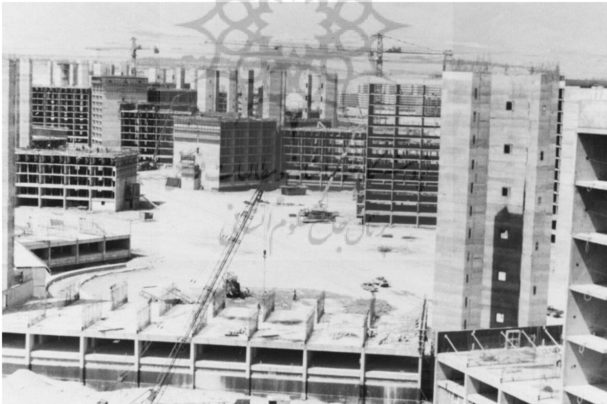
تصویر ۱: فاز یک شهرک اکباتان در حال ساخت،