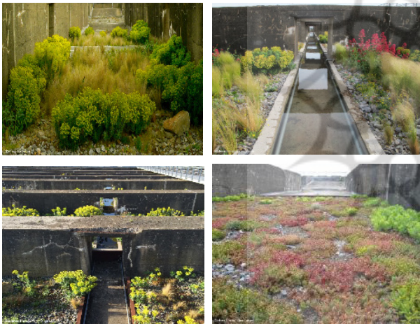
شکل ۵. پایگاه سن-ناز با تنوع رنگ و گونه‌های گیاهی خودرو در فصول مختلف [۵۵]

یکی از نمونه‌های شاخص تحقق عملی مفهوم منظر سوم و باغ‌های تاب‌آور، پروژه پایگاه زیردریایی سن-ناز (۲۰۱۱) است. یک بنای عظیم بتنی و متروکه، به‌جامانده از جنگ جهانی دوم، که سابق بر این به‌عنوان پناهگاه زیردریایی‌های آلمانی مورد استفاده قرار می‌گرفت. کلمان در بازآفرینی این مکان، به‌جای حذف یا پوشاندن تاریخ و خشونت نهفته در آن، رویکردی آشتی‌جویانه با طبیعت اتخاذ می‌کند و فضا را به بستری برای بازسازی اکولوژیکی بدل می‌سازد. کلمان در این پروژه، با بهره‌گیری از اصل عدم مداخله مستقیم، اجازه می‌دهد که طبیعت با روندهای درونی خود به احیای این فضای رها شده بپردازد. در دل سازه‌های زمخت و سخت بتنی، گیاهان خودرو، خزه‌ها، گل‌سنگ‌ها و پرندگان کم‌کم به زندگی بازمی‌گردند. این بازپس‌گیری آرام طبیعت، تجلی عینی مفاهیم کلمان است (شکل ۵). فضایی بدون عملکرد رسمی، که شاید از نگاه طراحی سنتی فرانسه (باروک و مدرن) فاقد طرح مشخص هندسی و نازیبا محسوب شود، اما در واقع ظرفیت عظیمی برای بازسازی اکولوژیکی، ارتقای تنوع زیستی، رسیدن به پایداری و حتی بازبازی خاطره جمعی در دل خود دارد [۵۳، ۵۴].