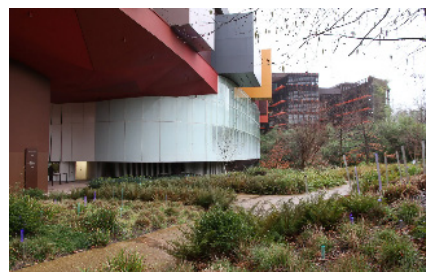
شکل ۴. باغ موزه کوی برانلی در پاریس [۳۴، ۵۱، ۵۲]