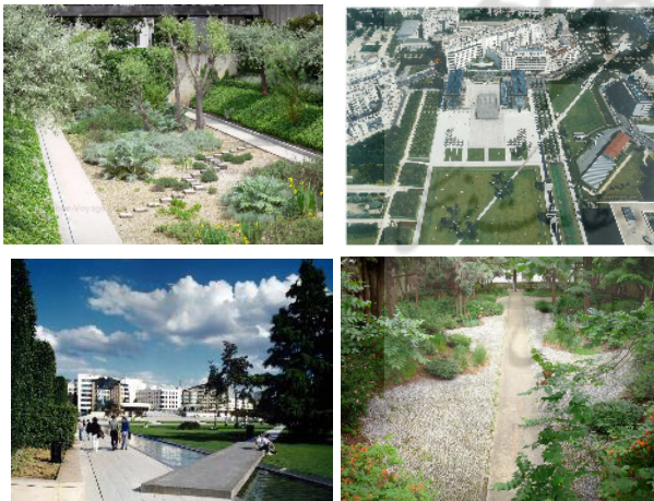
شکل ۳. باغ در حرکت در پارک سیتروئن در پاریس [۴۱، ۴۲]

پروژه‌ی بازآفرینی کارخانه‌ی متروکه‌ی سیتروئن در دهه‌ی ۱۹۹۰ با همکاری دو معمار منظر دیگر انجام شد، زمینه‌ای عملی برای تجلی مفاهیم نظری ژیل کلمان و ارائه‌ی رویکرد نوآورانه‌ی او در طراحی فضاهای سبز شهری فراهم کرد. او توانست در بخشی از این پارک مفهوم باغ در حرکت خود را به نمایش بگذارد (شکل ۳). در باغ در حرکت پارک آندره سیتروئن ۵ ، طراحی به گونه‌ای انجام گرفت که ترکیبی از نظم طبیعی انتخاب گونه‌های مقاوم، بومی یا مهاجر، و رهاسازی بخشی از باغ به فرآیندهای طبیعی، نه تنها تنوع زیستی را گسترش داده، بلکه تجربه‌ی ادراکی بازدیدکننده را نیز ژرف‌تر و چندلایه‌تر می‌سازد. طراحی پارک، بازدیدکننده را به مشارکت در کشف تدریجی فضا دعوت می‌کند، جایی که تغییرات فصلی، رشد گیاهان، و تعامل انسان با محیط، همگی در شکل‌گیری معنا و هویت فضا نقش دارند [۴۰].