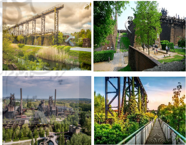
شکل ۶. پارک دویسبورگ نورد در آلمان [۶۰، ۶۱]

حال که چستی و چگونگی مفاهیم کلمان بررسی کردیم، این نکته اهمیت پیدا می‌کند که اندیشه و مفاهیم او چگونه در منظر شهر بازتاب یافته‌است؟ کلمان با تأکید بر پیوند علم اکولوژی با منظر شهری، یکپارچگی بین ساختارهای طبیعی و انسان ساز را در شهر مطرح کرد. از جمله پروژه‌های متأثر از مفاهیم و ایده‌های کلمان می‌توان به پارک، دویسبورگ نورد (۱۹۹۱) در منطقه روهر آلمان اشاره کرد که در پی ارزشمندی اراضی متروکه صنعتی در بافت شهری و گسترش آگاهی‌های زیست‌محیطی و توجه به حفاظت از طبیعت ساخته شد [۵۸، ۵۹]. تأثیر دیدگاه کلمان بر لاتز در طراحی این پارک نه‌تنها در بازتاب عناصر طبیعی و رویش‌های خودجوش، بلکه در درک منظر به‌عنوان یک فرآیند پویا و در حال تکامل نیز دیده می‌شود. پارک به گونه‌ای طراحی شده که توالی طبیعی گیاهان، بهره‌برداری هنرمندانه از سازه‌های صنعتی (نگاه همزمان به تاریخ، فرهنگ و طبیعت) و تعامل اجتماعی در بستری واحد در هم تنیده شده‌اند (شکل ۶).