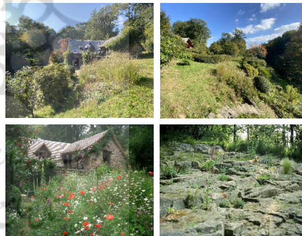
شکل ۲. باغ لاواله در فرانسه [۳۴، ۳۵]

نخستین مفهوم کلیدی او یعنی باغ در حرکت، از تجربه زیسته‌اش در باغ لاواله ۹ (۱۹۸۰) در جنوب فرانسه نشأت می‌گیرد. زمینی متروکه که به بستری برای تجربه، مشاهده و درک پویایی طبیعت بدل شد. در این فضا، او با دقت و تداوم، رشد طبیعی و خودانگیخته‌ی گونه‌های خودرو و بومی را مشاهده کرد [۳۲]. گونه‌هایی که بدون مداخله انسانی، با نظمی درونی و پویایی زیستی به‌گونه‌ای منسجم رشد می‌کردند (شکل ۲). این تجربه همانگونه که روکا می‌گوید، نقطه‌ی مقابل پارادایم طراحی در پارک‌های مدرن بود که در آن‌ها، فضاهای سبز به‌منزله‌ی سازه‌هایی ایستا، از پیش طراحی شده و تمام‌شده تلقی می‌شدند [۳۳].