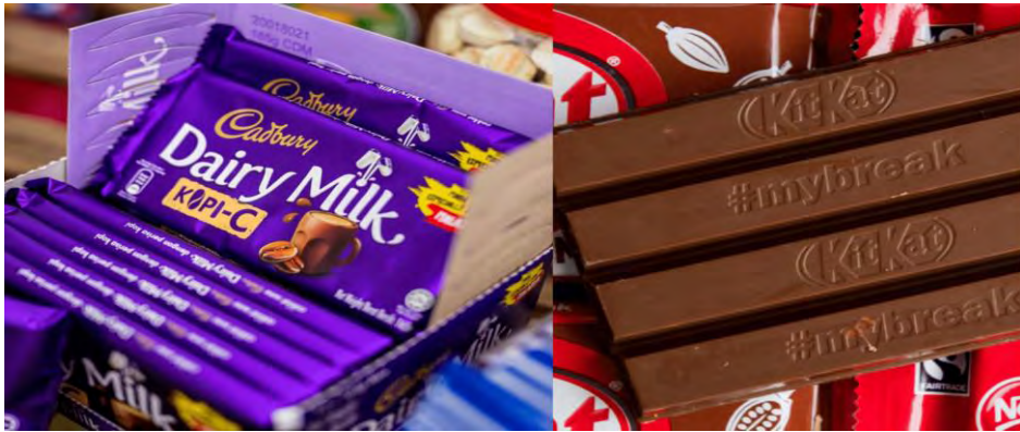
شکل ۳- سمت چپ شکل سه بعدی شکلات‌های کیت کت و سمت راست شکل سه بعدی شکلات‌های ماندلز