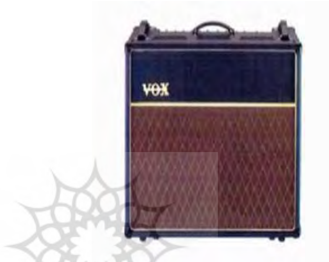
شکل ۴- الگو الماس بر روی بلندگو ۲

باید نشان داده شود. ۱ به‌عنوان نمونه‌ی ثبت‌شده از این دسته از علائم، با تمسک به تمایزبخشی اکتسابی در دفتر ثبت اصلی، می‌توان به الگوی الماس ووکس بر روی بلندگوهای تولیدی‌اش اشاره کرد.