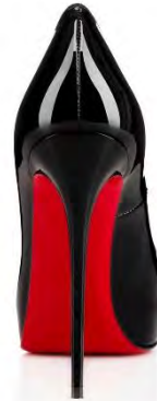
شکل ۱- کفش لوبوتین

تا به امروز فروشگاه‌های لوبوتین در بیش از ۳۰ کشور گسترش یافته‌اند. محصولات این شرکت همچنین از طریق خرده‌فروشان متعدد و بازارهای برخط در دسترسند. بنابراین جای تعجب نیست که لوبوتین تلاش قابل توجهی برای حمایت از کفش‌های خود در برابر رقبا انجام داده و اظهارنامه‌های ثبتی خود را در اکثر کشورهایی که فروشگاه خرده‌فروشی کفش دارند، از جمله فرانسه، مکزیک، سنگاپور، نیوزیلند، مغولستان، استرالیا، ایالات متحده آمریکا، مالدیو، فیلیپین، کامبوج، لائوس، برونئی، اندونزی، مراکش، بحرین، شیلی، سوئیس، ویتنام، مالزی و هند ثبت کرده است. ۱ اولین مورد از این اظهارنامه‌ها در سال ۲۰۰۰ در فرانسه ثبت شد. پس از به دست آوردن حمایت علائم تجاری در فرانسه، لوبوتین با یک اظهارنامه در سراسر اتحادیه‌ی اروپا ثبت شد