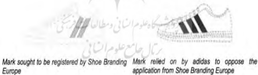
شکل ۶- دو نمونه از علائم مورد تقاضا برای ثبت به عنوان علامت الگو