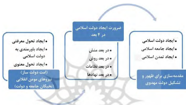
شکل ۲- راهبرد اساسی انقلاب اسلامی برای گذار از دولت اسلامی به جامعه‌ی اسلامی مبتنی بر پرورش انسان

دولت اسلامی مطلوب، نه صرفاً ساختاری، بلکه دارای محتوایی اسلامی در رفتار کارگزاران، ساختارهای اداری، الگوهای مدیریتی و شیوه‌های تصمیم‌گیری است. واژه‌ی «امت» در این گفتمان، ناظر بر گروهی هدف‌مند از جامعه است که به‌واسطه‌ی اشتراک در مبانی عقیدتی نظیر توحید، نبوت، معاد و ولایت، به‌صورت منسجم و تشکیلاتی در مسیر تحقق اهداف الهی حرکت می‌کنند. امت اسلامی با بهره‌گیری از روش‌ها و منش‌های اسلامی، از طریق تقسیم وظایف، انسجام سازمانی، و بهره‌برداری از ظرفیت‌های مردمی، نقش اصلی را در طراحی و اجرای نقشه‌ی راه دولت اسلامی ایفا می‌نماید (خدادی و منیری، ۱۳۹۸، ص ۱۵۶).