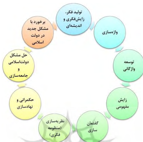
شکل ۱- چرخه‌ی راهبرد اساسی انقلاب اسلامی برای گذار از دولت اسلامی به جامعه‌ی اسلامی مبتنی بر فکروورزی

جامعه‌ی اسلامی گذر کند و در نهایت به مرحله‌ی تمدن‌سازی برسد. تمدن اسلامی روندی دقیق، ضابطه‌مند و منطبق با سنت‌های الهی دارد که تفکر و تأمل، هسته‌ی مرکزی آن را تشکیل می‌دهد؛ لذا اندیشه‌ورزی، عنصری حیاتی و ضروری برای تحقق تمدن اسلامی است.