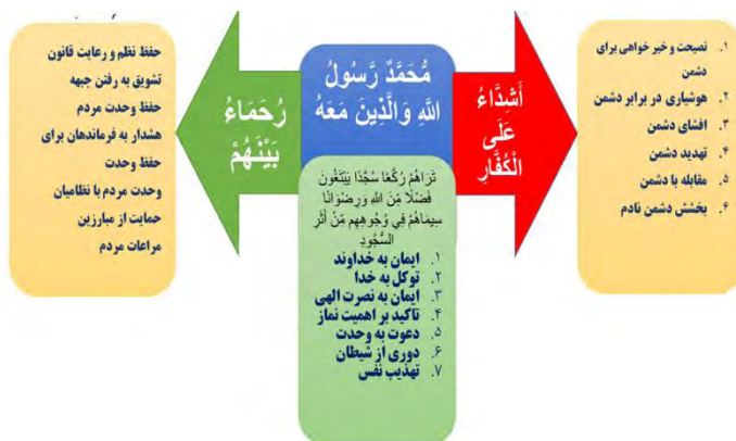
تصویر ۲- الگوی مفهومی اندیشه‌ی حکمرانی امنیتی از منظر امام خمینی

اکنون باتوجه به مطالعات انجام‌شده، اصول حاکم بر جهان‌بینی و اندیشه‌ی حکمرانی امنیتی را در دوازده محور می‌توان جمع‌بندی نمود که در تصویر (۳) این اصول آورده شده است. لازم است تا کنش‌گران حکمرانی امنیتی باتوجه به این اصول، به گسترش و تقویت اندیشه و جهان‌بینی حکمرانی امنیتی خود پردازند.