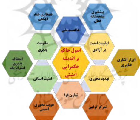
تصویر ۳- اصول حاکم بر جهان‌بینی و اندیشه‌ی حکمرانی امنیتی (نگارنده)

اکنون باتوجه به مطالعات انجام‌شده، اصول حاکم بر جهان‌بینی و اندیشه‌ی حکمرانی امنیتی را در دوازده محور می‌توان جمع‌بندی نمود که در تصویر (۳) این اصول آورده شده است. لازم است تا کنش‌گران حکمرانی امنیتی باتوجه به این اصول، به گسترش و تقویت اندیشه و جهان‌بینی حکمرانی امنیتی خود پردازند.