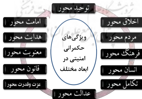
تصویر ۱- ویژگی‌های حکمرانی امنیتی اسلامی از منظر مقام معظم رهبری

حکمرانی امنیتی به‌عنوان بُعدی از ابعاد حکمرانی باید واجد ویژگی‌های متعدد و در عین حال یکپارچه‌ای باشد که مقام معظم رهبری آنها را در جملات مختلف بیان فرموده‌اند. از این جملات، اندیشه‌ی حکمرانی امنیتی را نیز می‌توان واجد ویژگی‌هایی دانست که در قالب یک نمودار در تصویر (۱) ارائه شده است.