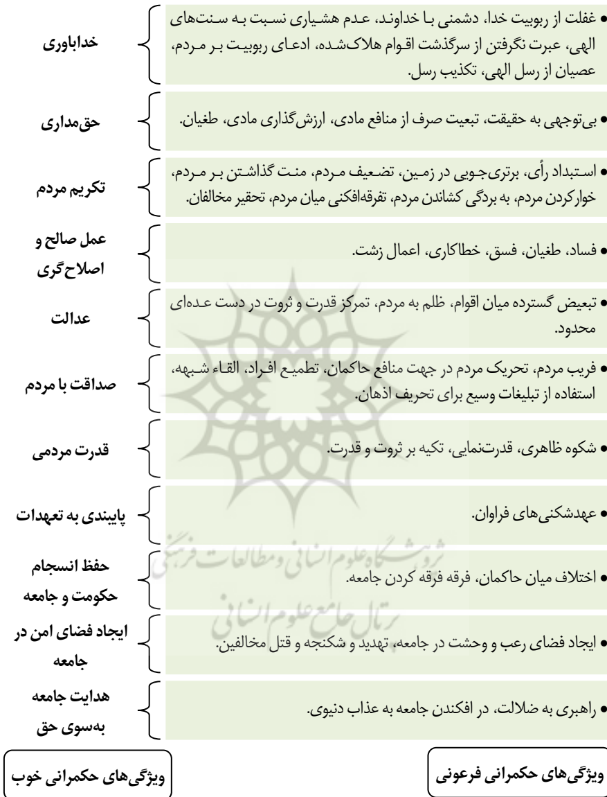
شکل ۲: ویژگی‌های حکمرانی خوب در مقایسه با ویژگی‌های حکمرانی فرعونی

براین اساس، برخی از ویژگی‌های حکمرانی خوب از منظر قرآن به همراه ویژگی‌های حکمرانی فرعونی که نقطه‌ی مقابل آن‌ها هستند، در شکل زیر نمایش داده می‌شود: