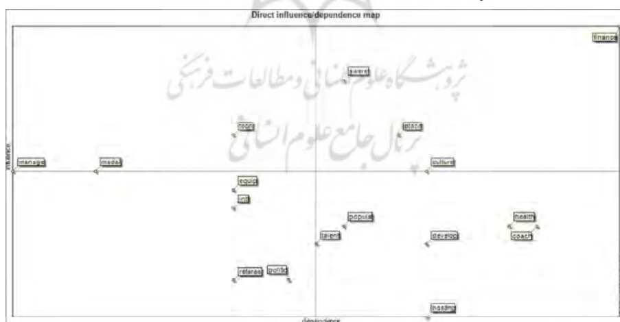
شکل ۳: وضعیت مولفه‌های مستقیم کلیدی موثر بر آینده تکواندو در خروجی میک‌مک

ماتریس تأثیرات غیرمستقیم بین متغیرها برخلاف ماتریس تأثیرات مستقیم، تأثیراتی را که از طریق متغیرهای میانی اعمال می‌شوند، بررسی می‌کند. به عبارت دیگر، تأثیراتی که از طریق یک یا چند متغیر دیگر منتقل می‌شوند. این ماتریس برای تحلیل پیچیدگی‌ها و زنجیره‌های تأثیرات در سیستم‌های پیچیده استفاده می‌شود. در این ماتریس مولفه‌های آگاهی ورزشکاران، تکنولوژی، منابع مالی، ملاحظات فرهنگی و اجتماعی و مدال آوری در صدر قرار دارند.