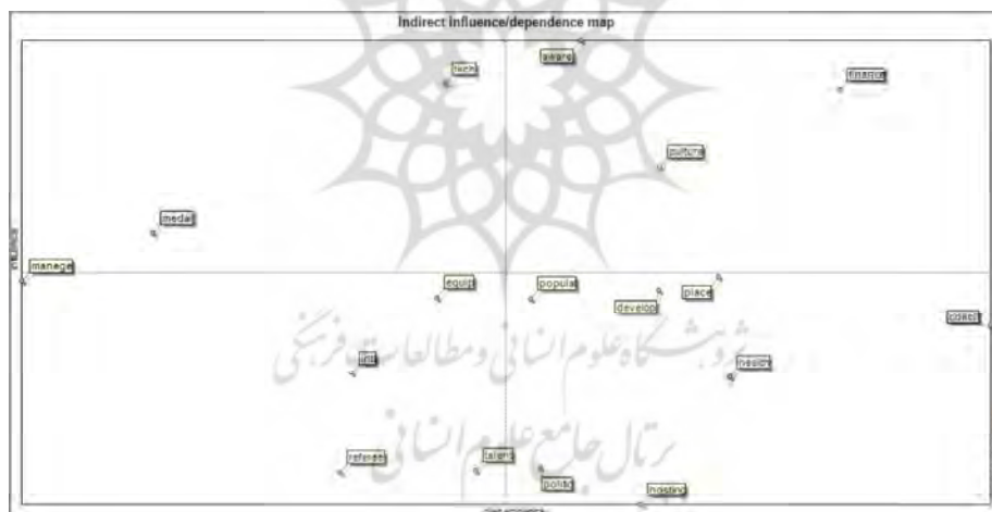
شکل ۴: وضعیت مولفه‌های غیرمستقیم کلیدی موثر بر آینده تکواندو در خروجی میک‌مک

شکل ۴ نقشه تأثیر/وابستگی غیرمستقیم را نشان می‌دهد که روابط بین متغیرهای مختلف بر اساس تأثیر و وابستگی غیرمستقیم آنها را بصری‌سازی می‌کند. متغیرهایی که در بخش بالا-چپ قرار دارند، تأثیر بالاتری دارند ولی وابستگی کمی دارند؛ و بالعکس، متغیرهایی که در بخش پایین-راست قرار دارند، وابستگی بالاتری دارند ولی تأثیر کمتری دارند.