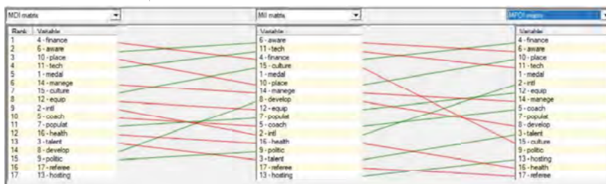
شکل ۲: تاثیر مولفه‌ها به صورت مستقیم (چپ)، غیرمستقیم (وسط) و بالقوه مستقیم (راست) در خروجی میک‌مک

می‌شود. این ماتریس برای تحلیل و درک ارتباطات مستقیم بین عوامل مختلف استفاده می‌شود. منابع مالی، آگاهی ورزشکاران، اماکن ورزشی، تکنولوژی و مدال آوری بیشترین تاثیر مستقیم را بر آینده تکواندو دارند.