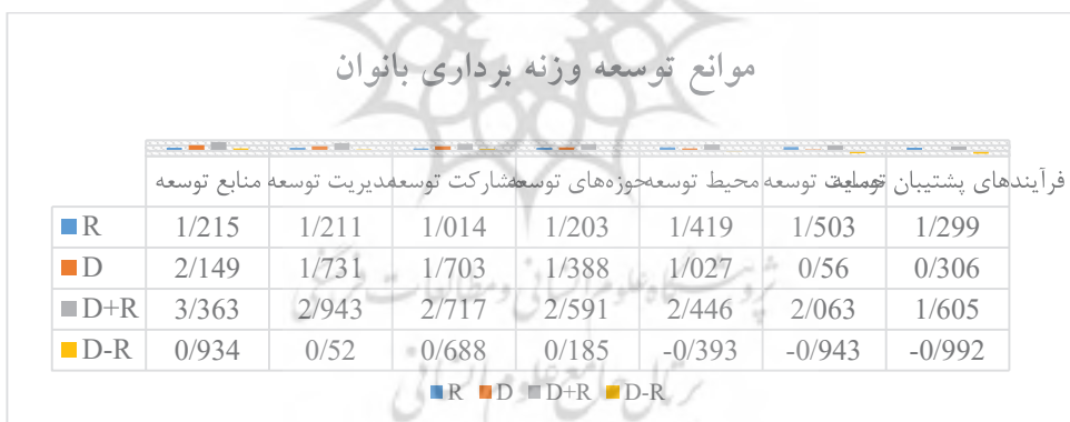
شکل ۱. نمودار الگوی روابط موانع توسعه وزنه برداری زنان

باتوجه به جدول فوق هر عامل از چهار جنبه بررسی می‌شود: بردار افقی ( D + R ) میزان تأثیرگذاری و تأثیرپذیری عامل مورد نظر در سیستم را نشان می‌دهد. به عبارت دیگر هرچه مقدار D + R عاملی بیشتر باشد، آن عامل تعامل بیشتری با سایر عوامل سیستم دارد. در این تحقیق موانع منابع توسعه از بیشترین تأثیرگذاری برخوردار است و موانع مدیریت توسعه و مشارکت توسعه در درجات بعدی تأثیرگذاری قرار دارند. بردار عمودی ( D - R ) قدرت تأثیرگذاری هر عامل را نشان می‌دهد. به طور کلی اگر D - R مثبت باشد، متغیر یک متغیر علی محسوب می‌شود و اگر منفی باشد، معلول محسوب می‌شود. در این تحقیق موانع و ضعف منابع، مدیریت و مشارکت علی بوده و موانع و ضعف محیط، حوزه‌های توسعه، حمایت و فرایندهای پشتیبان معلول به حساب می‌آیند. در نهایت، شکل زیر نیز الگوی روابط معنی‌دار را نشان می‌دهد. این الگو در قالب یک نمودار هست که در آن محور طولی مقادیر D + R و محور عرضی بر اساس D - R است. موقعیت و روابط هر عامل با نقطه‌ای به مختصات ( D + R, D - R ) در دستگاه معین می‌شود.