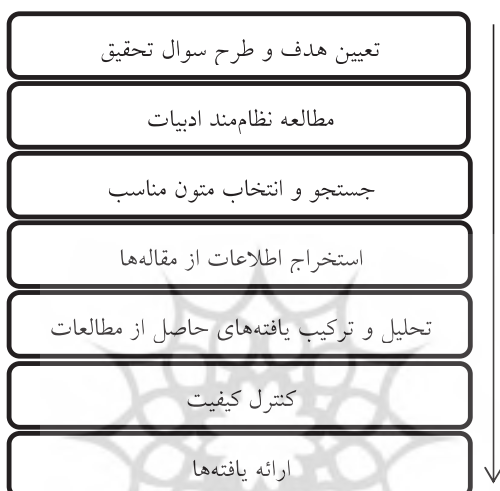
شکل (۱). گام‌های فراترکیب بر اساس روش هفت مرحله‌ای ساندلوسکی و بارسو (۲۰۰۶)

اصلی انتخاب پژوهش‌ها، ترکیب ترجمه‌ها و ارائه ترکیب را ارائه داده‌اند و همچنین، ساندلوسکی و بارسو ۱ (۲۰۰۶) روش هفت گامی را برای این منظور معرفی کرده‌اند. در این تحقیق برای دستیابی به اهداف پژوهش و پاسخ به سوال‌ها، از روش هفت مرحله‌ای ساندلوسکی و بارسو (۲۰۰۶) استفاده شد که به عقیده چنایل ۲ (۲۰۰۹) یکی از جامع‌ترین روش‌های انجام تحقیق با رویکرد فراترکیب است و مراحل آن در شکل (۱) مشخص شده و در ادامه به این مراحل بطور مبسوط اشاره شده‌است.