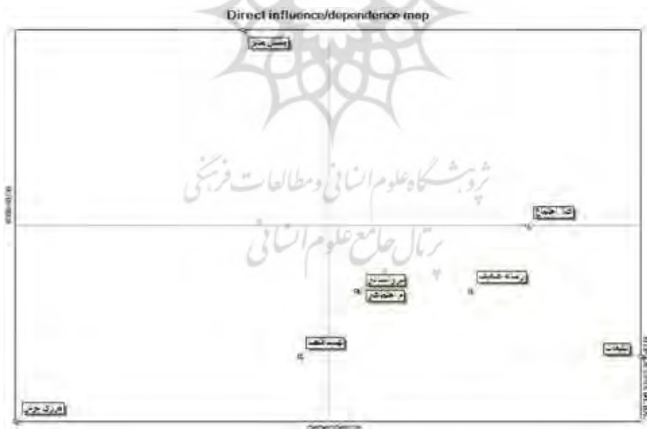
شکل ۱: پلان تاثیرگذاری و تاثیرپذیری سیستم

همانطور که ملاحظه می شود، بیشترین میزان تاثیرگذاری مربوط به مولفه مشکلات مدیریتی و بیشترین میزان تاثیرپذیری نیز مربوط به فرصت تبلیغات می باشد.