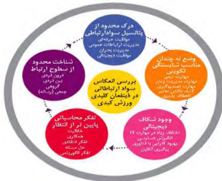
شکل ۱. دامنه‌ها و موضوعات فرعی استخراج شده Figure 1. Domains and sub-topics extracted

حرفه‌ای خودم و همچنین توسعه ورزش کبیدی در کشور را تسهیل و ترویج می‌کنم»؛