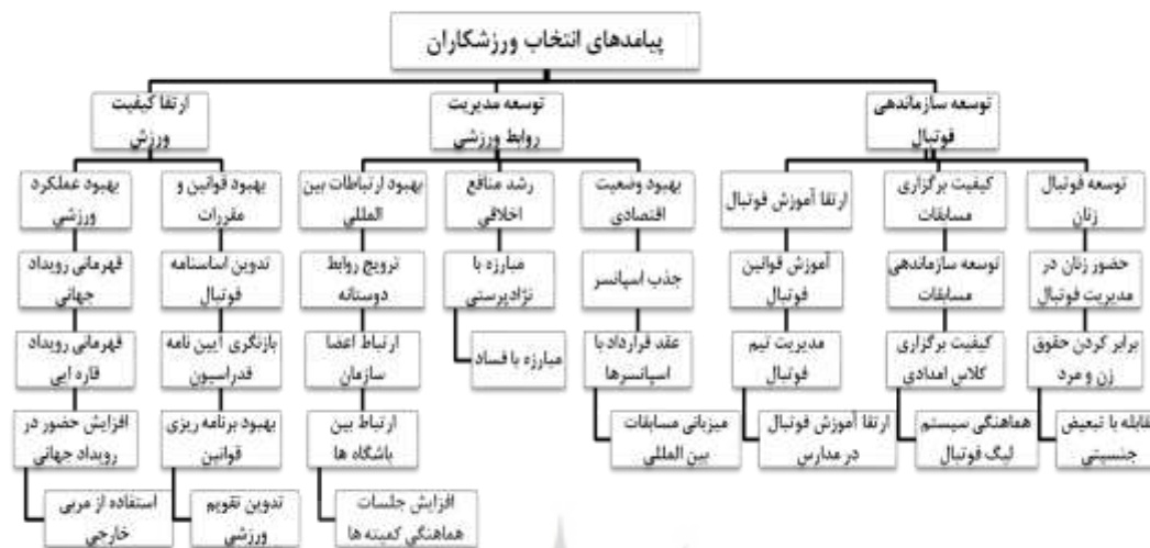
شکل ۲- نقشه تماتیک یافته‌های اسنادی و گزارش‌های خبری