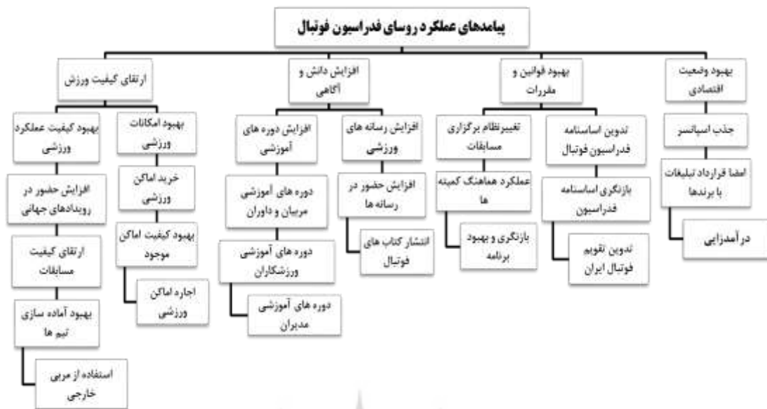
شکل ۱- نقشه تماتیک عملکرد رؤسا در طول تاریخ تأسیس فدراسیون فوتبال