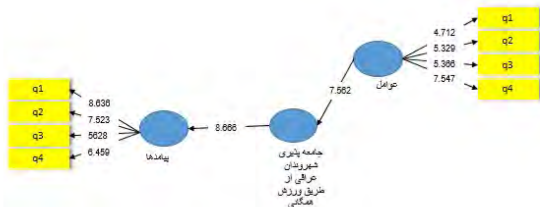
شکل ۳. مدل ساختاری تأیید شده همراه با ضرایب معناداری t

مقدار ملاک برای مناسب بودن ضرایب بارهای عاملی، 0/4 است و سنجش‌های دارای بارهای عاملی کمتر از 0/4 ، می‌بایست از مدل حذف شود. مطابق با شکل بالا تمامی ضرایب بارهای عاملی، بزرگ‌تر از 0/4 بوده و بدین ترتیب مدل ارائه شده در پژوهش حاضر از برازش خوبی برخوردار است و تأیید می‌شود؛ همچنین مدل موردنظر همراه با ضرایب معناداری t در شکل ۳ نشان داده شده است.