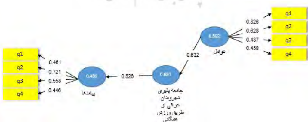
شکل ۲. مدل ساختاری تأییدشده همراه با بارهای عاملی

در بخش مدل‌سازی معادلات ساختاری جهت سنجش برازش مدل، از پایایی شاخص، روایی همگرا و روایی واگرا استفاده شد. پایایی شاخص برای سنجش پایایی درونی، شامل سه معیار ضرایب بارهای عاملی، آلفای کرونباخ و پایایی ترکیبی است. بر این اساس، مدل ساختاری تأییدشده همراه با ضرایب بارهای عاملی مطابق شکل‌های ۲ و ۳ ارائه می‌شود.