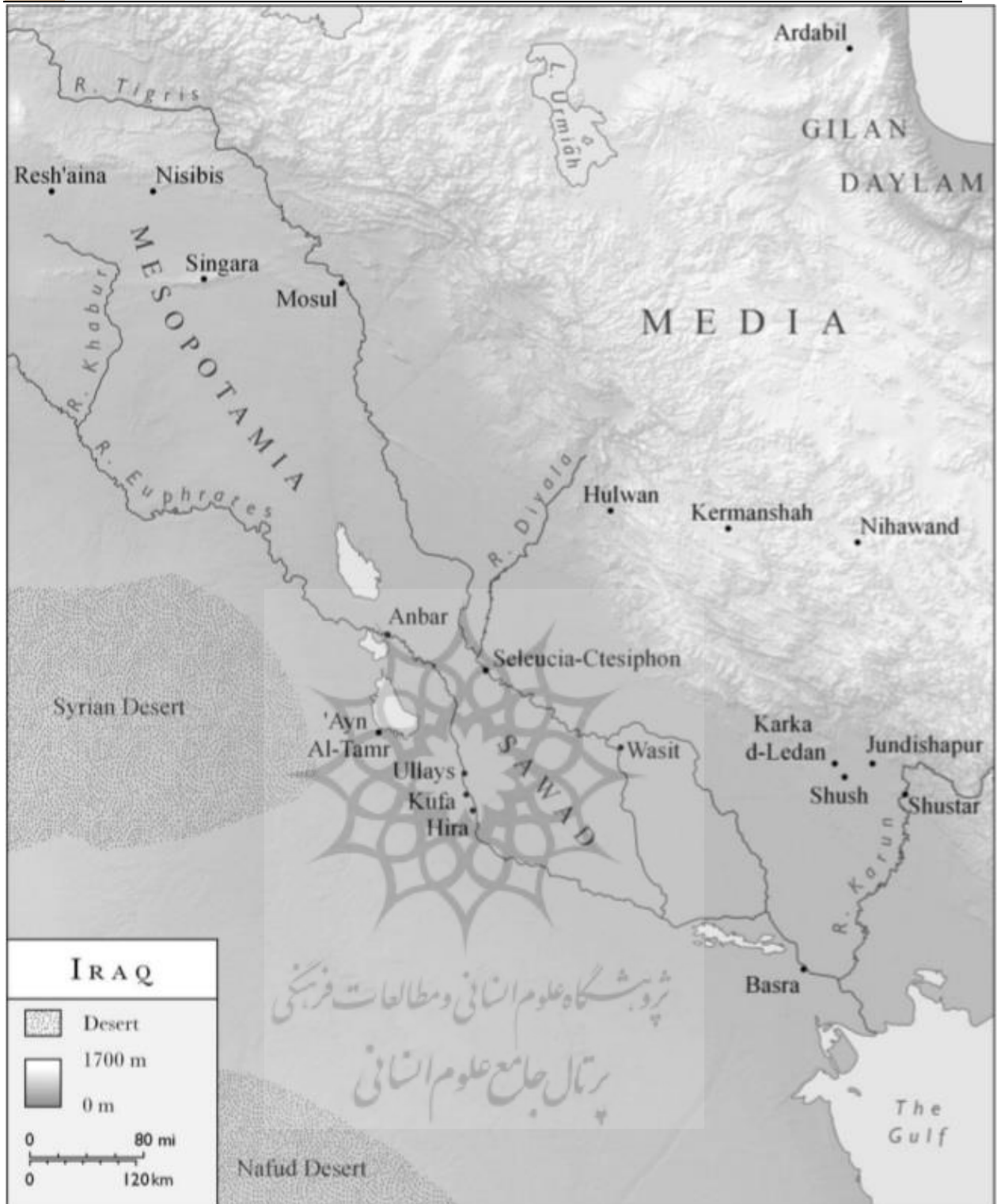
عراق و غرب ساسانی (Hoyland, 2015: 50)