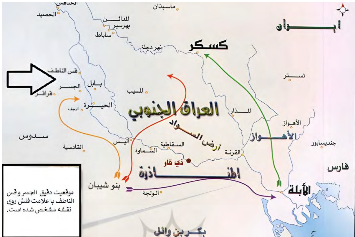
نقشه: موقعیت ناحیه الجسر (مغلوث، ۱۴۳۰ه.ق.: ۲۵)