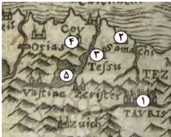
نقشه شماره ۳. شمال غرب ایران در نقشه جدید ایران از گاستالدی (Rumsey, David Rumsey Historical Map Collection)

کرد (نقشه شماره ۳). در این نقشه، نامی از «چالدوران» در شمال غرب ایران نیست. با وجود این، خوی که «چالدوران» از توابع آن به شمار می‌رفت، به وضوح نمایان است. این الگو در نقشه جدید روسلی (Roselli) از ایران که مربوط به سال ۹۶۸ق/۱۵۶۱م. است نیز تکرار شده و به نام «چالدوران» که مکان آن در حوالی خوی بود، اشاره نشده است. از جمله مناطق شمال غربی ایران در این نقشه عبارت است از: ۱. تبریز، ۲. شماخی، ۳. تسوج، ۴. خوی، ۵. دریاچه وان، ۶. وسطان، ۷. ارزیل (ورزقان) (نقشه شماره ۴).