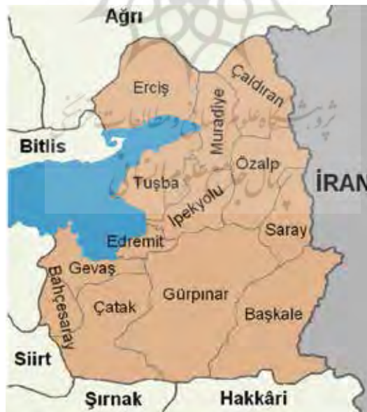
نقشه شماره ۲. موقعیت چالدران در ترکیه امروزی