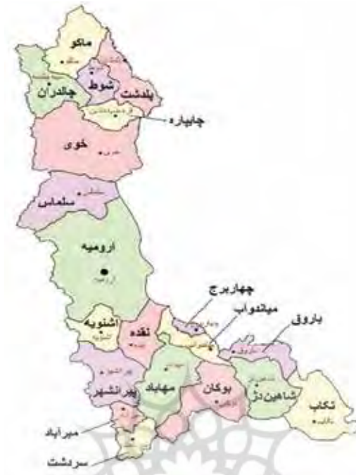
نقشه شماره ۱. موقعیت چالدران در ایران امروزی (استانداری آذربایجان غربی)