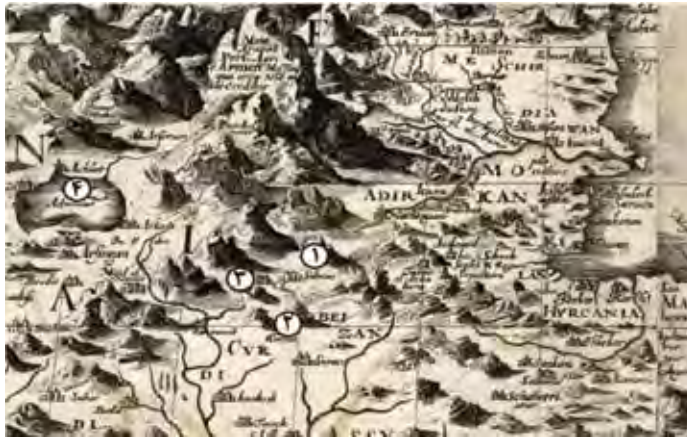
نقشه شماره ۸. شمال غرب ایران در نقشه آدام اولناریوس (Olearius, 1656: 779)

علاوه بر آن، در تکاپوهای جغرافیایی نقشه‌نگاران اروپایی در ترسیم چهره جغرافیایی ایران در اواخر عصر صفوی و نیز سنت‌های جدید نقشه‌نگاری اروپایی که مبتنی بر آگاهی‌های به‌روزتر بود، با وجود اشاره به ده‌ها نام جغرافیایی، اشاره‌ای به نام چالدران نشد. نقشه ترسیمی ایران در سال ۱۱۳۶ق/۱۷۲۴م. توسط «گیوم د. لیل» (Guillaume Delisle) فرانسوی که در پاریس منتشر شد، مصداق و نمونه مناسبی از افول نام چالدران در نقشه‌نگاری اروپایی از اواخر عصر صفوی به شمار می‌رود. در این نقشه، گیوم د. لیل در حد فاصل بین: ۱. قپان تا ۲. میانه و از ۳. دریاچه وان تا ۴. کوه آزارات یا آغری‌داغ، ده‌ها نام جغرافیایی از شهرها و آبادی‌ها گرفته تا مجموعه‌ای از پدیده‌های طبیعی به‌ویژه رودخانه‌ها و نواحی کوهستانی را نام‌شناسی و مکان‌یابی کرده و علی‌رغم اشاره به نواحی نزدیک به «چالدران» مثل خوی، خبری از نام چالدران نیست (نقشه شماره ۹).