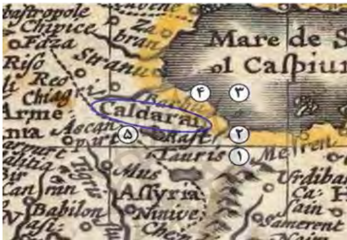
نقشه شماره ۷. نام «چالدران» در نقشه جهانی نیکولاس ویسچر (Rumsey, David Rumsey Historical Map Collection)

علاوه بر دو نقشه اورتلیوس و اسپید درباره نام «چالدران»، اوج کاربرد این نام در نقشه‌نگاری اروپایی و در عین حال، آخرین نشانه‌های بازتاب این نام در نقشه‌ها را می‌توان در یک نقشه جهانی از نیمه سده ۱۱ ق/۱۷م. ردیابی کرد که از دنیای شناخته شده آن روزگار ترسیم شد. این نقشه توسط نیکولاس ویسچر (Nicolas Visscher) هلندی در سال ۱۰۶۲ ق/۱۶۵۲م. و در آمستردام منتشر شد. چالدران در این نقشه در مجاور غربی سرحدات ایران با عثمانی قرار داشت و به ترتیب: ۱. تبریز در جنوب شرق ۲. رشت در شرق ۳. دریای مازندران در شرق ۴. باکو در شمال و شمال شرق و ۵. مرزهای ایران و عثمانی در جنوب و جنوب غرب نام چالدران، جانمایی شدند (نقشه شماره ۷).