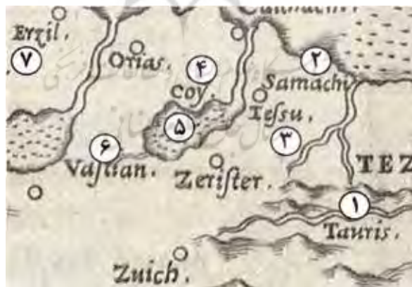
نقشه شماره ۴. شمال غرب ایران در نقشه جدید ایران از روسلی (Alai, 2010 [a]:40)

نخستین نشانه‌های پدیداری و برآمدن نام «چالدوران» در نقشه‌نگاری اروپاییان را می‌توان در نقشه آبراهام اورتلیوس (Abraham Ortelius) از قلمرو سرزمینی صفویان (Persici sive Sophorum)