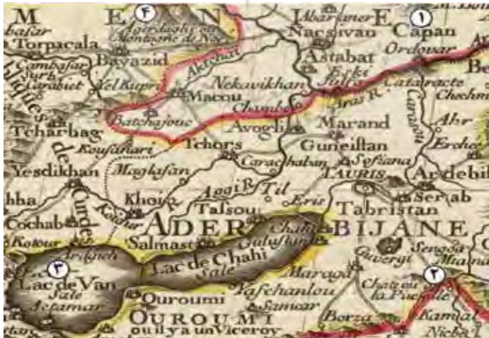
نقشه شماره ۹. شمال غرب ایران در نقشه گیوم د. لیل فرانسوی (Delisle, 1731: Map of 80)