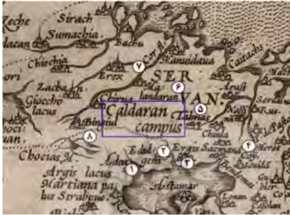
نقشه شماره ۵. نام «چالدران» در نقشه ابراهام اورتلیوس (Ortelius, 1570: 49)

Regni Typus) پیدا کرد که در سال ۹۷۷ق/۱۵۷۰م منتشر شد. این نام در نواحی شمال غربی ایران و در مجاور سرحدات ایران با عثمانی به صورت «Caldaran» ضبط شده و در حدود جغرافیایی آن: ۱. اخلاط در جنوب ۲. عادل جوز در جنوب ۳. ارجیش در جنوب ۴. خوی با یک فاصله جغرافیایی در شرق ۵. سلماس در شرق ۶. شیروان در شمال شرق ۷. رود کر در شمال و ۸. مرزهای ایران با عثمانی در جنوب و غرب نام چالدران، جانمایی شدند (نقشه شماره ۵).