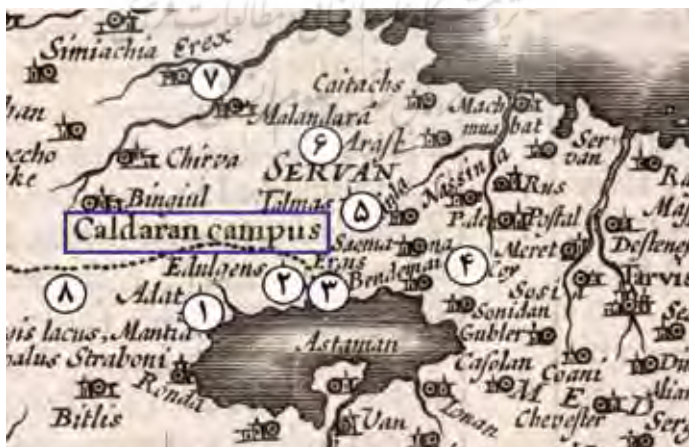
نقشه شماره ۶. نام «چالدردان» در نقشه جان اسپید (Speed, 1626: 33-34)

درواقع، مبنایی که اورتلیوس برای نام‌گذاری «چالدردان» در نقشه‌های اروپایی بنیان گذاشت، زمینه‌ای برای نقشه‌نگاران بعدی فراهم کرد تا آنان نیز مطابق ساختار توصیفی اورتلیوس، نام «چالدردان» را ضبط کنند. از جان اسپید (John Speed) یکی از نقشه‌نگاران نیمه نخست سده ۱۱ق/ ۱۷م انگلیس، نقشه‌ای با عنوان «پادشاهی ایران» (The Kingdom of Persia) منتشر شده در سال ۱۰۳۵ق/ ۱۶۲۶م. در لندن در دست است که همانند ساختار نقشه اورتلیوس، به نام «چالدردان» اشاره شد. گفتنی است نام چالدردان تنها در برخی از نقشه‌ها ضبط شده و در بیشتر نقشه‌های ترسیمی از ایران در فاصله زمانی بین چاپ نقشه‌های اورتلیوس و اسپید، این نام ضبط نشده است. در نقشه اسپید، همانند پسوند و برجستگی‌های نقشه‌های قبلی: ۱. اخلاط در جنوب ۲. عادل جوز در جنوب ۳. ارجیش در جنوب ۴. خوی با یک فاصله جغرافیایی در شرق ۵. سلماس در شرق ۶. شیروان در شمال شرق ۷. رود کر در شمال و ۸. مرزهای ایران با عثمانی در جنوب و غرب نام «چالدردان» جانمایی شدند (نقشه شماره ۶).