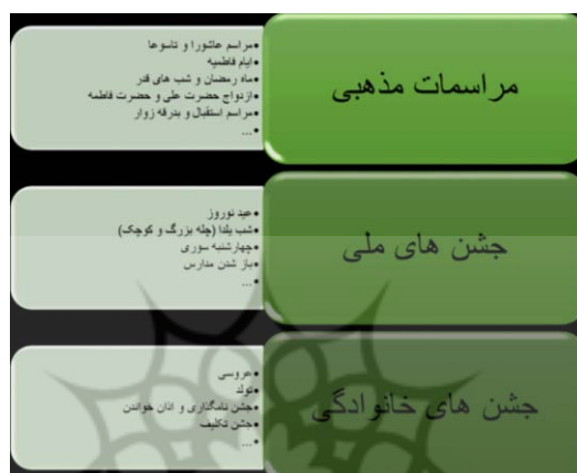
(شکل-۷): دسته‌بندی آداب اجتماعی بر اساس بررسی‌های میدانی

مراسم‌های ایرانیان بنا بر آداب و رسوم نیازهایی دارند که باعث تکاپو و خرید در بازار می‌شد؛ مثلاً مراسم خنچه‌بردن که در شب یلدا، عید نوروز، عید قربان و غدیر با قراردادن هدایا در طبق‌های چوبی و تزیین آن برای تقدیم به او عروس و داماد خانواده آن‌ها موجب حضور خانواده‌ها برای خرید در بازار می‌شد.