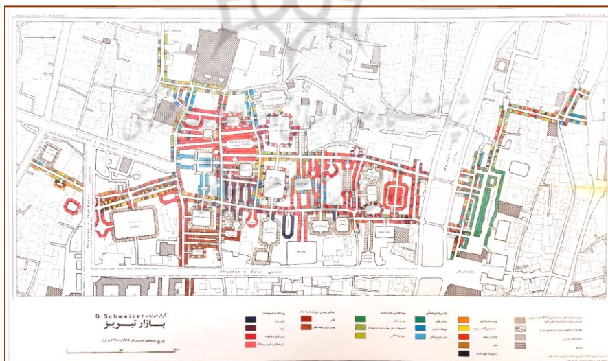
(شکل-۵): نقشه توزیع کسب و کارها در بازار تبریز (۱۳۸۴ ش.)