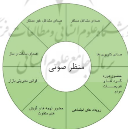
(شکل-۲): مدل مفهومی عوامل مؤثر در بازار تاریخی تبریز

با مطالعه مؤلفه‌های مطرح‌شده در کتاب شفر و بازخوانی این مؤلفه‌ها در فرهنگ زندگی شهری در ایران، مؤلفه‌های زیر قابل بررسی هستند: