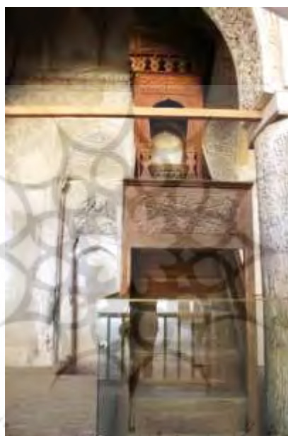
شکل ۵: تصویر نمای محراب مسجد جامع نائین (دیالمه)

اولین محراب بررسی شده از دوره سلجوقی در شبستان زیرزمینی مسجد جامع روستای ویونا یا ایبانه واقع شده است. با قرار گرفتن قطعات چوب گردو در کنار یکدیگر محراب این مکان ساخته شده که جنس این محراب، آن را از سایر آثار متمایز می‌کند. «با توجه به رواج آجرکاری و گچ‌کاری در ساخت آثار دوره سلجوقی مشخص می‌شود که استفاده از مصالح چوبی در ساخت‌وسازها چندان معمول نبوده است که این موضوع، اهمیت پیدایش محرابی از جنس چوب را بیش از پیش آشکار می‌سازد» (زنگنه اینانلو، ۱۳۹۱: ۹). کتیبه‌های نقر شده بر آن از تنوع عبارات برخوردارند. متون و عبارات چنین است: بر حاشیه بیرونی و گرد محراب، آیت الکرسی، کنده‌کاری شده است؛ حاشیه دوم در سمت راست عبارت «الملک لله» ۲ مرتبه و در قسمت چپ همین حاشیه عبارت «الله اکبر» و «الحمد لله» نمایان است.