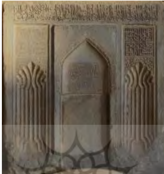
شکل ۲: تصویر محراب مسجد جامع عتیق شیراز (موزه هفت تنان شیراز)

سومین اثر بررسی شده مربوط به مسجد جامع نیریز و دوره آل بویه می باشد. محراب گچ بری آن که در انتهای ایوان جنوبی قرار گرفته شامل تزئینات و خطوط پرکار است و ردی هم از هنر دوره صفوی بر آن مانده است.