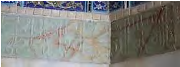
شکل ۱۱: تصویر مرکز محراب مسجد جامع کرمان (آیات ۲۸ و ۲۹ سوره فتح) (مظفری)