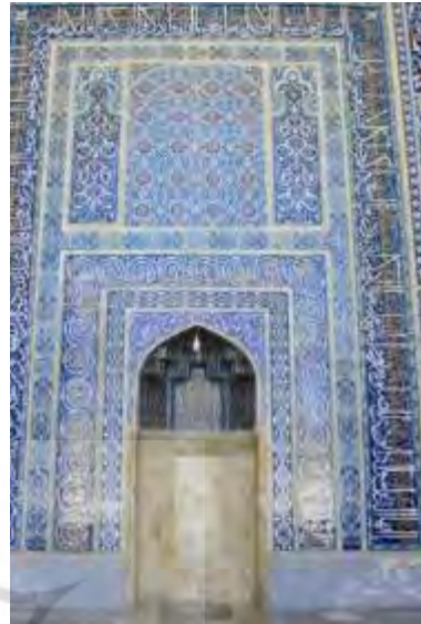
شکل ۱۰: تصویر محراب مسجد جامع کرمان (مظفری)

در استان یزد مسجد جامع میبد جزء مساجد اولیه ایران محسوب می‌شود که بنیان آن مربوط به حدود سده دوم هجری می‌باشد. مسجد دارای دو محراب تابستانه و زمستانه است. محراب تابستانی شامل دو قسمت است: محراب معرق کاشی که در قسمت بالا مشاهده می‌شود، به تاریخ ۵۸۶۷ ه.ق.، متعلق به دوره تیموری است. روی اضلاع نام «محمد» و دوازده امام آمده است. قسمت ابتدایی آن آسیب دیده و قابل خوانش نیست. در زوایای بالا اسامی «الله، محمد، علی» به چشم می‌آید. در میانه عبارت «لا اله الا الله محمد رسول الله علی ولی الله» نگارش شده است. در قسمت پایین آن ذکر «یا علی» به صورت قرینه تکرار شده است.