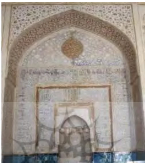
شکل ۱۳: تصویر نمای محراب گنبدخانه مسجد جامع ساوه (صفوی)

محراب مسجد جامع هشتگرد که قدمت آن به دوره قاجار می‌رسد نیز از آثار مورد بررسی است که در میانه محراب آجری، کتیبه مرمری مشاهده می‌شود که به خط نستعلیق در قسمت بالا نام «الله، محمد، علی، فاطمه، حسن، حسین» و در حاشیه کتیبه این بیت حجاری شده است: