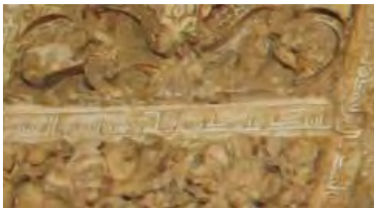
شکل ۹: تصویر محراب مسجد جامع ورامین. آیه ۱۳۷ بقره.