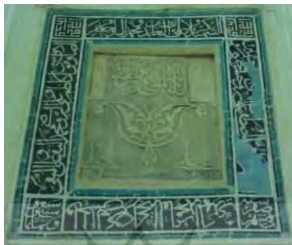
شکل ۱۲: تصویر محراب تابستانه کاشی معرق مسجد جامع میبد

در ادامه از دوره صفوی محراب گنبدخانه مسجد جامع ساوه خوانش و بررسی شده که بسیار پرکار و ظریف و دارای تزئینات رنگی است. توصیف حاشیه بیرونی با آیات ۹ و ۱۰ و قسمتی از ۱۱ سوره جمعه، و در دل آن آیات ۱۸ و بخشی از ۱۹ و ابتدای ۲۶ آل عمران، بسته می‌شود. حاشیه درونی از اواسط آیه ۱۱ جمعه آغاز می‌شود: «تَرَكَوكَ قَائِمًا قُلْ مَا... وَاللَّهُ خَيْرُ الرَّازِقِينَ». در ادامه این حاشیه عبارتی مانند «وقد قال عز اسمه» ۱ و به دنبال آن آیات ۷۸ و ۷۹ سوره اسری تا انتهای حاشیه دیده شده است. کتیبه بچه در حاشیه درونی، ادامه آیه ۲۶ آل عمران است و در حاشیه بیرونی چنین نوشته شده است: «الْمَلِكِ تُؤْتِي الْمَلِكَ مَنْ تَشَاءُ... إِنَّكَ عَلَى كُلِّ شَيْءٍ قَدِيرٌ».