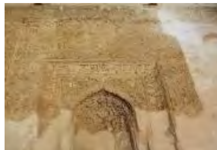
شکل ۸: تصویر محراب مسجد جامع ورامین