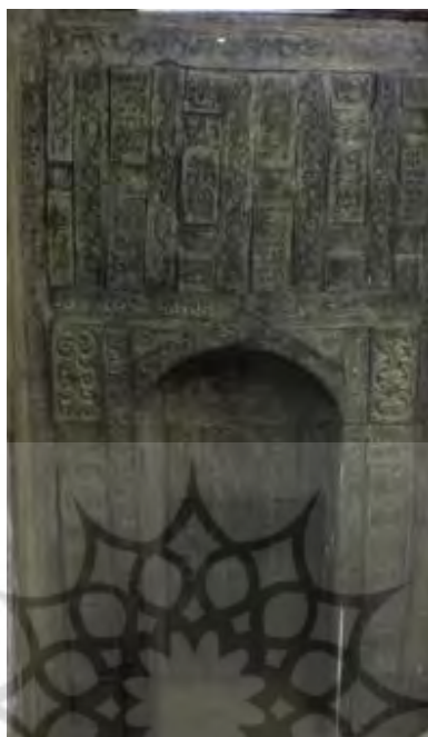
شکل ۶: تصویر محراب چوبی مسجد جامع ایبانه (سلجوقی)

بر حاشیه سوم آیه ۱۸ آل عمران: «شَهِدَ اللَّهُ أَنَّهُ لَا إِلَهَ إِلَّا هُوَ وَالْمَلَائِكَةُ وَأُولُوا الْعِلْمِ قَائِمًا بِالْقِسْطِ لَا إِلَهَ إِلَّا هُوَ الْعَزِيزُ الْحَكِيمُ» آمده است. در ادامه بخشی از آیه ۱۹ آل عمران «إِنَّ الدِّينَ عِنْدَ اللَّهِ» و به دنبال همین حاشیه و سمت چپ آیات ۳۴ و قسمتی از ۳۵ سوره فاطر: «الْحَمْدُ لِلَّهِ الَّذِي أَذْهَبَ عَنَّا الْحَزْنَ إِنَّ رَبَّنَا لَغَفُورٌ شَكُورٌ الَّذِي أَحَلَّنَا دَارَ الْمُقَامَةِ» خوانده شده که انتهای آن قابل خوانش نبود و با توجه به آیه نوشته شده و فضای باقی مانده احتمال می رود با «من فضله» به پایان رسیده باشد. خوانش این کتیبه در منبعی مشاهده نشده است. در مرکز محراب نیز حدیث «افعل على الصلواتك ولا تكن من الغافلين» نقش شده است و بر طاق مثلثی شکل، عبارت «لا اله الا الله محمد رسول الله» دیده و خوانده می شود.