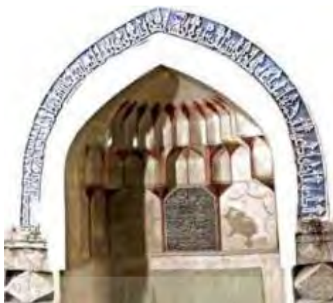
شکل ۱: تصویر محراب اصلی مسجد جامع شوشتر (عباسی)

دومین اثر، محراب مسجد جامع عتیق شیراز، متعلق به دوره صفاری است ۱ که در موزه هفت تنان شیراز نگهداری می‌شود و سال ساخت این محراب قرن سوم هجری ثبت شده است. محتوای کتیبه‌ها: در قسمت پیشانی این محراب سنگی سیاه، سوره حمد حجاری شده؛ در طاق نما عبارت «لا اله الا الله محمد رسول الله علی ولی الله»؛ در دو حاشیه و در مجموع ۸ مرتبه ذکر «سبحان الله» به صورت قرینه تکرار شده است.