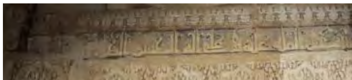
شکل ۴: تصویر کتیبه بالای محراب مسجد جامع نائین (دیالمه) (منبع: نگارندگان)