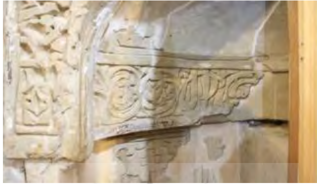
شکل ۷: تصویر عبارت الله ولی التوفیق (محراب مسجد جامع گناباد). (خوارزمشاهی)

برخی مقالات ساخت این محراب را دوره ایلخانی ذکر کرده‌اند.