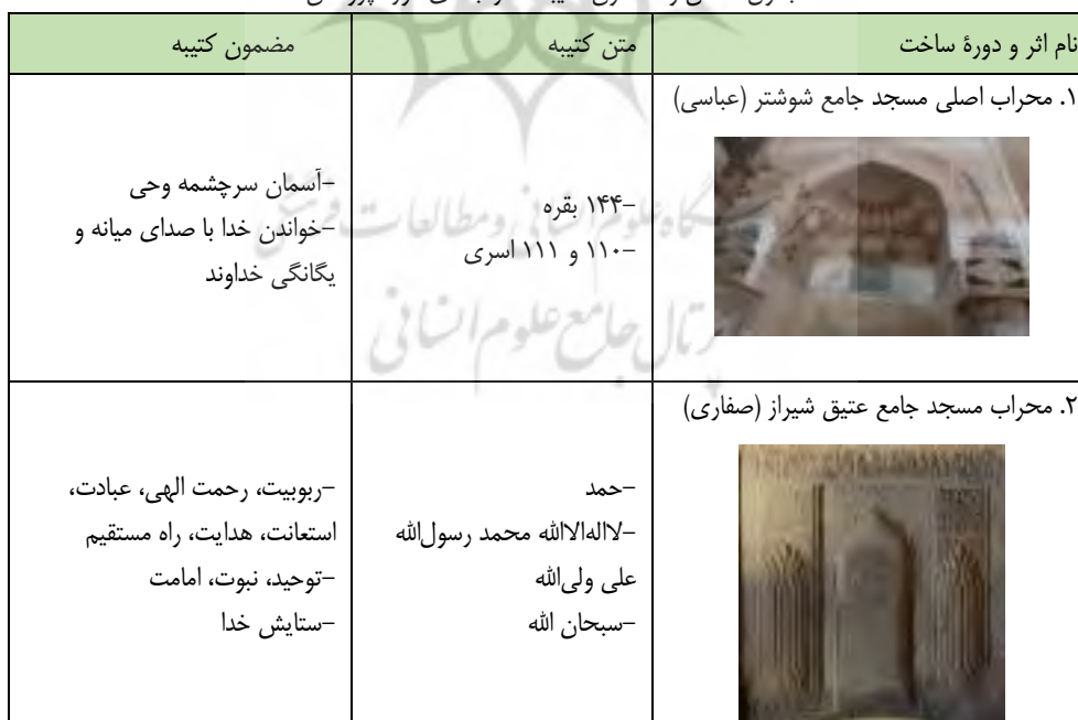
جدول ۲: متن و مضمون کتیبه محراب‌های مورد پژوهش

اطلاعات و تصاویر کلیه محراب‌های انتخاب‌شده به همراه متن و مضمون آن‌ها، در جدول زیر ارائه و دسته‌بندی شده است.