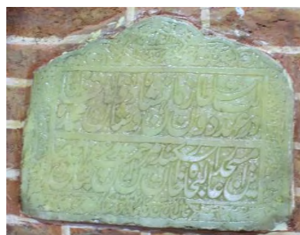
شکل ۱۴: تصویر محراب مسجد جامع هشترود (قاجار)

اطلاعات و تصاویر کلیه محراب‌های انتخاب‌شده به همراه متن و مضمون آن‌ها، در جدول زیر ارائه و دسته‌بندی شده است.