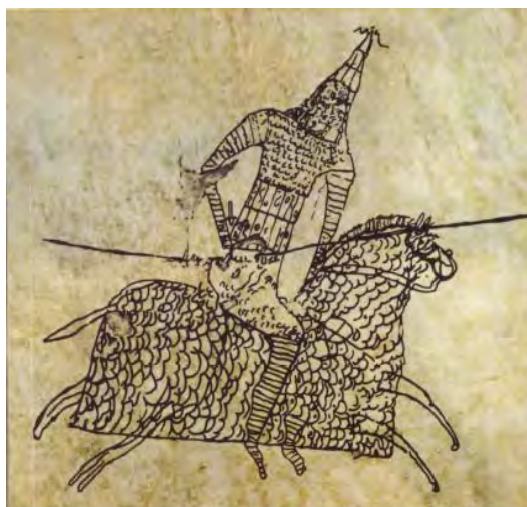
تصویر شماره ۵: سواره نظام اشکانی (جعفری دهکردی، ۱۳۹۶: ۱۳۴)

همانند دوره اشکانی، ساسانیان نیز به اسب و تیمار و نگه‌داشت این حیوان توجه ویژه‌ای داشتند. آنان همانند اسلاف خود مجبور به حفظ قلمرو گسترده ایران آن روزگار از آسیب اقوام وحشی‌ای بودند که سرزمین ایرانی‌تبار توران را استحاله کرده و بافت قومی آن را اندک اندک به نفع خود تغییر داده بودند. در دوره ساسانیان هونها و هیاطله از شرق تا معابر قفقاز قلمرو شاهنشاهی را تهدید می‌کردند، در غرب قدرت رقیب و مهاجم روم قرار داشت که تا حدود هزار سال بقای خود را در نابودی ایران می‌دید. و هم‌چنین در غرب قبایل غارتگر عرب که از کنترل مرزبانان حیره می‌رستند، به سرزمین‌های ایرانی آسیب‌زده و با شترهایشان در غبار صحرا محو می‌شدند. ایران در چنین وضعیتی ناگزیر از انتخاب بین تمدن و بربریت بود و نگهداری چراغ تمدن در این انتخاب سخت، جز با سامان‌دادن ارتشی قوی میسر نبود که بتواند در همه مرزها هم‌زمان بجنگد و خود را محکوم به پیروزی نداند. وجود چنین ارتشی جز با بهره‌کشی از اسبانی نژاده، چابک و رهوار، به مانند گولی افلیج می‌شد؛ از این روست که ساسانیان نهایت اهتمام خود را به پرورش اسبانی با سجه‌ها و خصایص بالا مصروف می‌داشتند (فریدنژاد، ۱۳۸۴: ۱۵۰).