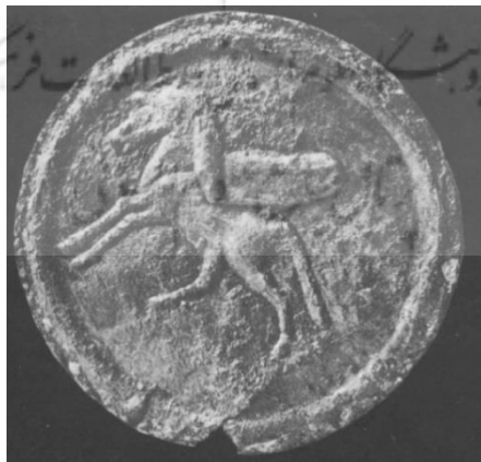
تصویر شماره ۲: اسب بالدار بر زین تزیینی و یراق اسب، یافته‌شده از حسن‌لو (قرن ۸ پ. م.)، موزه تهران (همان: ۲۹۱)