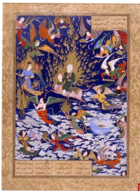
تصویر شماره ۱۲، معراج سلطان محمد، کتابخانه بریتانیا

( https://picryl.com/media/miraj-by-sultan-muhammad-6d4927 )