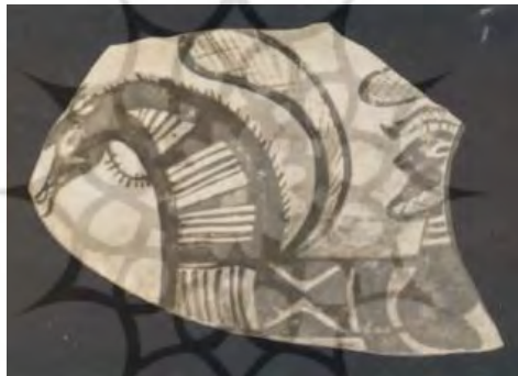
تصویر شماره ۱: مردی سوار بر اسب بالدار خود در حال عروج به آسمان، (قرن ۱۰ تا ۹ پ. م.)، موزه تهران (گیرشمن، ۱۳۷۱: ۱۴)

هم‌چنین در «تیریشت»، فرشته باران (تیشتر) به صورت اسب سپید باشکوهی با لگام زرین ظاهر می‌شود و با «آپوش» - دیو خشکسالی که او نیز به صورت اسبی سیاه و ترسناک مجسم شده - در آسمان می‌جنگد. در این نبرد، تیشتر سرانجام پیروز می‌شود و باران را به زمین می‌آورد (همان: ۲۳۹). این نبرد آسمانی نه تنها بر اهمیت اسب در صورت‌بندی روایی دین زرتشتی تأکید می‌کند، بلکه استمرار همان اسب نمادین کهن در قالبی تازه را نشان می‌دهد. در بخش‌های دیگر اوستا نیز به ارزش بالای اسب اشاره شده است. به عنوان نمونه، بهای یک اسب خوب، برابر با هشت گاو آبستن دانسته شده است و از توان دید استثنایی اسبان گفته می‌شود که در شب‌های تاریک ابری، می‌توانند موهای یال یا دم خود را از یکدیگر تشخیص دهند (پورداوود، ۱۳۹۰: ۲۳۶). حتی در آیین مهر، که با اوستا در برخی مفاهیم اشتراک دارد، اسب جایگاهی مقدس دارد. در «مهریشت»، از نیایش ارتشتاران در حال سواری یاد می‌شود که از ایزد مهر، نیرو و تندرستی برای اسب‌ها و خود طلب می‌کنند تا در رزم بر دشمنان پیروز شوند (دوستخواه، ۱۳۸۸: ۳۵۶). این نمونه‌ها همه گواه آن‌اند که اسب در اندیشه ایرانیان باستان، نمادی چندوجهی از قدرت، معنویت، و ارتباط آسمانی بوده است.