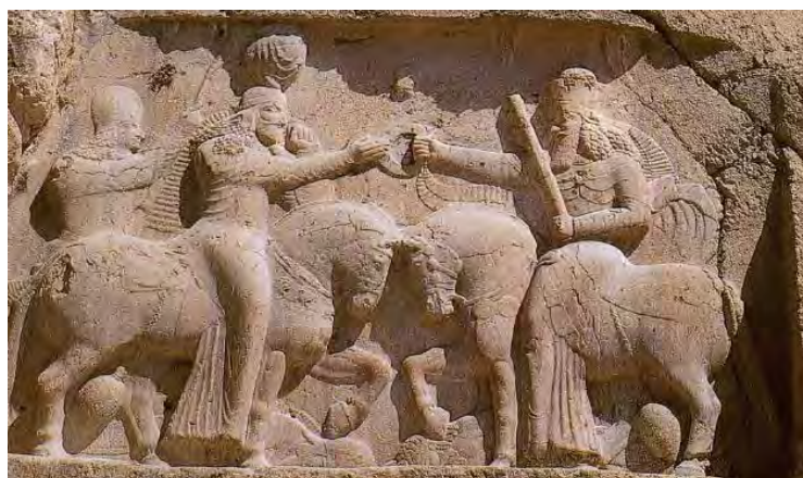
تصویر شماره ۶: دریافت نشان شهریاری توسط اردشیر بابکان از اهورامزدا

اردشیر بابکان در نقش رستم است که در وضعیت بسیار مطلوبی نسبت به آثار مشابه خود حفظ شده است (تصویر شماره ۶) (فریه، ۱۳۷۴: ۶۰).