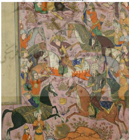
تصویر شماره ۸: صحنه نبرد و اسبان با تن‌پوش‌های تمام‌تنه و نیم‌تنه، کپل‌پوش و حناندوده‌شده (شاهنامه والترز W602) ( https://www.thedigitalwalters.org/Data/WaltersManuscripts/html/W602/description.html )