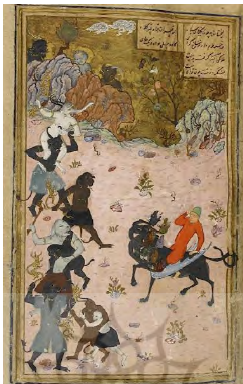
تصویر شماره ۷: تبدیل شدن اسب ماهان به اژدهایی هفت‌سر، نقاشی منسوب به بهزاد از خمسه نظامی متعلق به کتابخانه بریتانیا ( https://blogs.bl.uk/asian-and-african/2014/07/a-khamsah-ascribed-to-the-painter-bihzad-add-25900.html )