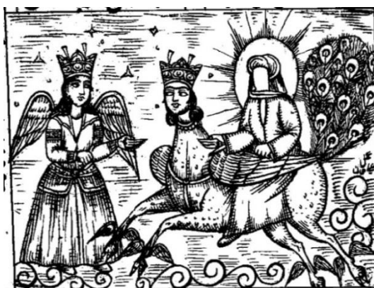
تصویر شماره ۱۱: پیامبر در معراج و استقبال جبرئیل از ایشان (همان: ۱۴۳)

در کهن‌ترین روایات اسلامی موجود از واقعه معراج، از این مرکب یاد شده است؛ گرچه در جزئیات، موضوع و توصیفات ظاهری آن اختلاف بسیار است. در بیشتر روایات، جانوری سپیدرنگ با جثه‌ای میان آستر و درازگوش توصیف گشته که دارای چشم‌های قرمز بوده و نزدیک ران‌هایش دو بال داشته و در هر گام به اندازه میدان دید خود پیش می‌رفته است. در برخی روایت‌ها، براق مرکب پیامبران دیگر به‌ویژه ابراهیم نیز بوده است. هم‌چنین در گرایش به توجیه عرفانی واژه، در برخی متون چون معراج‌نامه ابن سینا در بعضی از روایات، اسب دیگری به نام لزاز (تندرو) یا رسوب (برنده تا پایین) و درازگوش دیگری به نام عفیر (خاکی‌رنگ) را نیز به عنوان مرکب پیامبر (ص) ذکر کرده‌اند (بحارالانوار، ج ۱۶: ۹۸). ابوعلی سینا در توصیف براق این‌طور بیان می‌دارد: