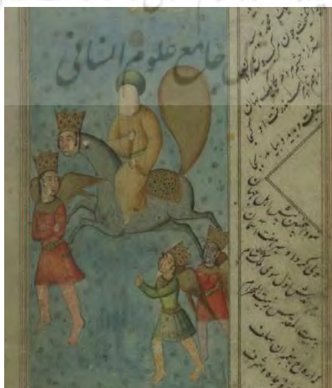
تصویر شماره ۱۰: نگارهٔ معراج پیامبر در نسخهٔ خطی حملهٔ حیدری (همان: ۱۴۴)

تصویر شماره ۹: معراج حضرت محمد (ص)، نسخهٔ جامع‌التواریخ رشیدی (جعفری دهکردی و همکاران، ۱۴۰۱: ۸۷) پیامبر از دروازهٔ سمت راست بیت‌المقدس وارد این شهر شد، براق آن حضرت را همراه جبرئیل تا در مسجد-الاقصی از سمت قبلهٔ آن آورد که بعدها به باب محمد (ص) معروف شد (انصاری، ۱۳۹۴: ۷۵). اسبی بالدار با خصوصیات غیر عادی که چهره‌ای شبیه آدمیزاد داشته است و این راه را برای تخیلات شاعرانه و نگارگران مسلمان و عرفا و متکلمین برمی‌گشود؛ به طوری که هر کدام از این منابع هنر و اندیشه، گنجینه‌ای از تفکرات و احساسات را در مورد براق و مرکب رسول اکرم (ص) پدید آوردند. (تصاویر شماره ۱۰ تا ۱۲) (به نقل از: جعفری دهکردی، ۱۳۹۶: ۱۳۰ و ۱۳۴).