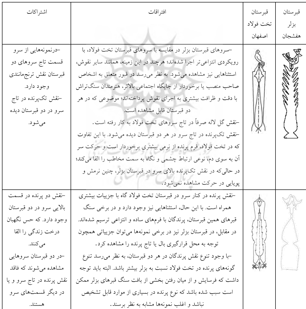
جدول ۳: تطبیق نقوش سرو در دو قبرستان بزلر و تخت فولاد

در مجموع، می توان نتیجه گرفت که نقش سرو در قبرستان های بزلر و تخت فولاد علاوه بر ارزش های زیبایی شناختی، حامل پیام های معنوی مهمی همچون جاودانگی، رستگاری و پیوند انسان با مفاهیم آسمانی است. این پیام ها در هر دو مجموعه، با ترکیب ها و شیوه های گوناگون هنری، بازتاب یافته اند.