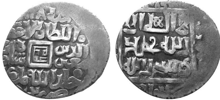
سکه پیرمحمد بن عمر شیخ بن تیمور (علاءالدینی، ۱۳۹۷، ص. ۱۵۰)

روی سکه: سنه ۱۱۸ق، السلطان الاعظم معین‌الدین محمد شاه‌رخ خلدالله ملکه، ضرب یزد.