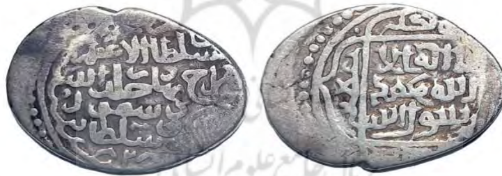
سکه شاه‌رخ تیموری

بازماندگان جلایریان، با استفاده از این فرصت، از سال ۸۱۱ق، حکومت خود را در خوزستان احیا کردند (حافظ ابرو، ۱۳۸۰، ج. ۳/۲۹۲-۲۹۴)؛ ولی بعد از غلبه شاه‌رخ بر برادرزادگان خود و انتصاب پسرش ابراهیم سلطان به حکومت فارس در سال ۸۱۷ق (جعفری، ۱۳۹۳، ص. ۶۳-۶۵؛ حافظ ابرو،