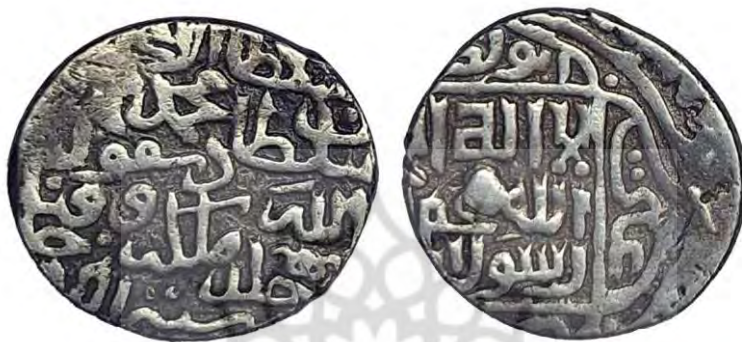
سکه محمد بن بایسنقر تیموری

روی سکه: [السلطان] الاعظم مغیث الدین الله الغ بیک کورکان خلدالله ملکه و سلطانه فی سنه ۸۵۱ق [ضرب] دزفول. پشت سکه (مرکز): لاله‌الاله - محمد رسول‌الله. حاشیه پشت سکه: ابوبکر، عمر، [عثمان، علی]. جنس: نقره وزن: ۴.۴۹ گرم قطر: -.