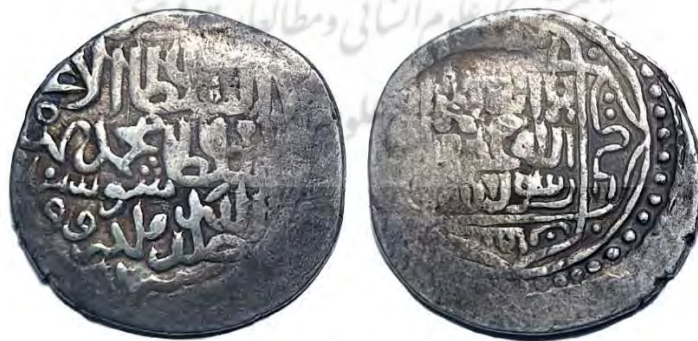
سکه محمد بن بایسنقر تیموری

روی سکه: السلطان الاعظم سلطان محمد بهادر خلدالله ملکه و خلافه [ضرب] دسغول (دزفول) سنه ۸۵۱ق. پشت سکه (مرکز): لاله‌الاله - محمد رسول‌الله. حاشیه پشت سکه: ابوبکر، [عمر، عثمان، علی]. جنس: نقره وزن: ۴.۷۷ گرم قطر: ۲۰.۰۳ میلی‌متر.