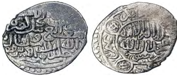
سکه الغ بیک بن شاهرخ تیموری ( https://www.numisbids.com/sale/6003/lot/2101 )

روی سکه: [السلطان] الاعظم مغیث الدین الله الغ بیک کورکان خلدالله ملکه و سلطانه فی سنه ۸۵۱ق [ضرب] دزفول. پشت سکه (مرکز): لاله‌الاله - محمد رسول‌الله. حاشیه پشت سکه: ابوبکر، عمر، [عثمان، علی]. جنس: نقره وزن: ۴.۴۹ گرم قطر: -.