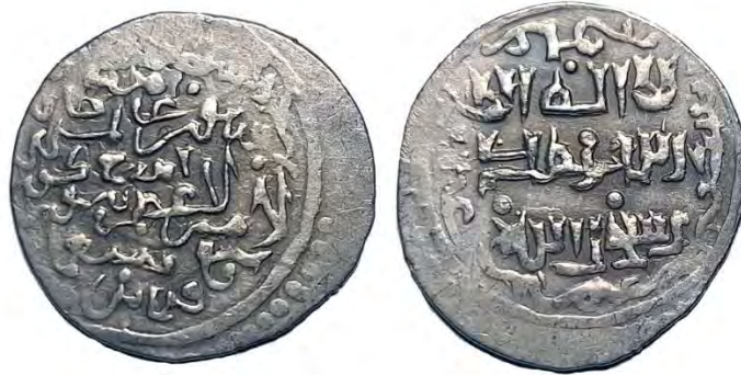
سکه تیمور کورکان روی سکه: السلطان الاعظم سیورغتمش خان الامیر الاعظم تیمور کورکان. [ضرب] ایذج (ایذه) [سنه] سبع ثمانین سبعمائہ (۷۸۷ق). پشت سکه: لاله‌الاله محمد رسول‌الله. حاشیة پشت سکه: ابوبکر، عمر، علی، عثمان. جنس: نقره وزن: ۱.۹۶ گرم قطر: ۲۱ میلی‌متر.