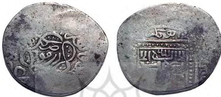
سکه تیمور کورکان

را تا ساحل بطایح و جزایر تسخیر کرد و تیمور نیز در ۱۶ ربیع‌الآخر ۷۹۵ق، بدون مقاومت نظامی وارد دزفول شده، با گرفتن پیشکش هنگفت و تصاحب اسب و استران شهر، به سوی شوشتر پیش رفت. بزرگان و اشراف شوشتر نیز در ۱۸ ربیع‌الآخر بدون مقاومت تسلیم شدند و تیمور، ضمن یک هفته اقامت در آن شهر، اموال و چهارپایان آنجا را تحت عنوان