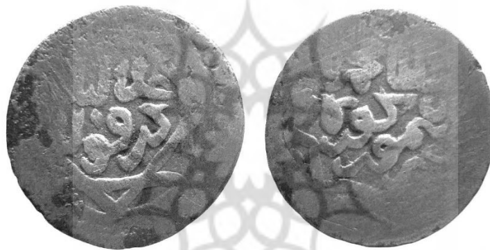
سکه تیمور کورکان (علاء‌الدینی، ۱۳۹۷، ص. ۶۰) روی سکه: السلطان محمود خان [امیر] تیمور کورکان. پشت سکه: عدلیة دزفول. جنس: مس وزن: ۴.۲۰ گرم قطر: ۲۱.۴۰ میلی‌متر.

به مذهب حنفی، توجه به سادات، شیعیان، تشیع و شعائر شیعی را برجسته ساخت.