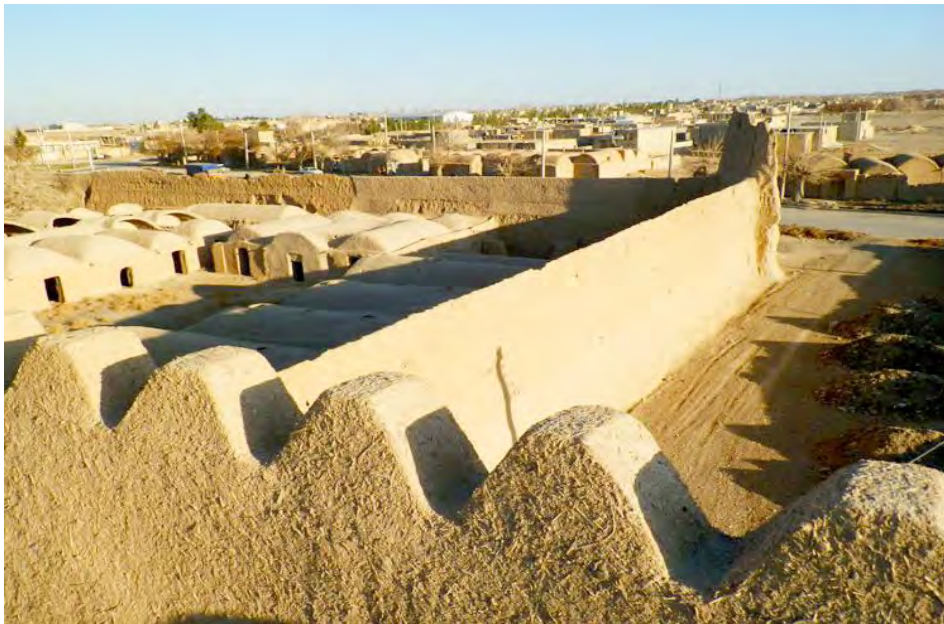
شکل ۲. قلعه ملکی هرات

قلعه قلعه‌های متعدد دیگری هم دارند که نشان‌دهنده دغدغه امنیت برای ساکنان آن طی سده‌های متمادی است. شایان ذکر است با توجه به تخریب گسترده بافت تاریخی در هرات و مروست به‌علت سیل‌های پرشمار نمی‌توان به‌طور دقیق کاربری قلعه‌های منطقه را تشخیص داد؛ زیرا در دوران باستان و اسلامی برخی از قلعه‌های قهندز (کهندژ) در میانه شهر بودند (یعقوبی، ۱۳۷۴، ج. ۱۷۲/۲) و مشخص نیست شهرهای هرات و مروست دارای «ربض» یعنی حصار بیرونی شهر بوده‌اند یا خیر. باوجود این شاید بتوان وجود چنین قلعه‌های مستحکم و بزرگی در منطقه هرات و مروست را نشان‌دهنده رونق راه‌های تجاری بین فارس و کرمان در دوره‌های ساختشان دانست. این نکته را نباید از نظر دور داشت که نقشه و اجزای تشکیل‌دهنده این قلعه‌ها بیشتر حاکی از سکونت‌گاه خان‌ها و حکام محلی است و برخلاف قلعه‌های روستایی جایی برای زندگی اهالی در آن‌ها مشاهده نمی‌شود.