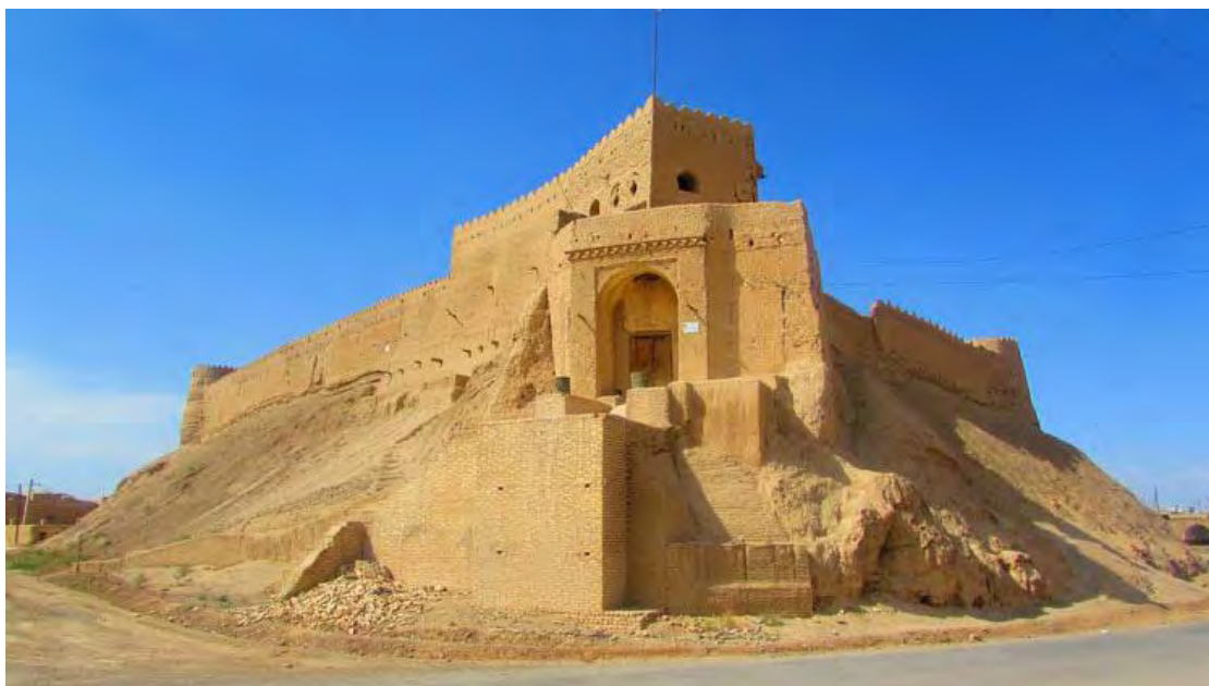
شکل ۳. قلعه مروست

اسلامی بدون جمعیت عشایری بوده است؛ بنابراین عشایر فعلی این استان اکنون نیز پیوندهای قوی با همگنان خویش در فارس و کرمان داشته و ییلاق قشلاق آن‌ها هنوز به مقصد کرمان و فارس انجام می‌شود (مولایی هاشجین، ۱۴۰۰، ص. ۱۵). از منظر زمین‌شناسی این دو شهرستان بخشی از حوزه آبریز ابرکوه و سیرجان محسوب شده‌اند.