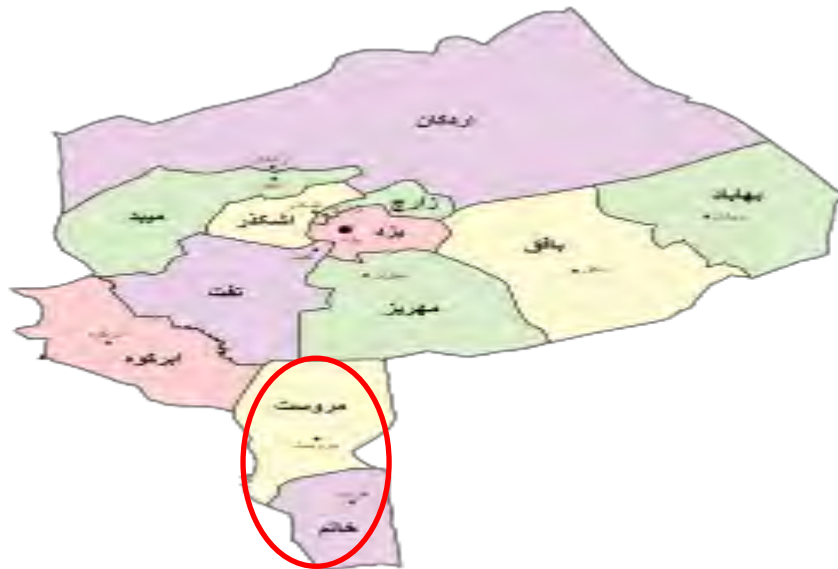
شکل ۱. نقشه استان یزد

درازا نکشید و سرانجام در دهه‌های منتهی به انقلاب اسلامی همچنان در قلمرو کرمان قرار داشت (مرکز آمار ایران، ۱۳۵۵، ص. ۱۸). در سال ۱۳۸۸، ورثه ابوالفتح خان، قلعه ملکی را به میراث فرهنگی واگذار کرده و این بنا به ثبت ملی رسید. ابوالفتح خان، مالک عمده زمین‌های هرات و مروست محسوب می‌شد. وی فرزند فرج‌الله خان و فرج‌الله خان فرزند عیسی خان خطاط و رجل عهد قاجار بود. پیش از عیسی خان پدرش حاج محمد علی خان بر منطقه سیادت داشت. از عیسی خان به‌عنوان حاکم ثلاث شهربابک، هرات و مروست در عهد قاجار نام برده‌اند (باستانی پاریزی، ۱۳۵۳، ص. ۱۳۱). گفتنی است در فرمان‌های حکومتی عصر قاجار معمولاً سه شهر یادشده باهم به حکام واگذار می‌شدند؛ چنان‌که در سال ۱۲۵۵ ق از سوی پادشاه قاجار شهربابک، هرات و مروست به اقطاع، به کهندل خان افغان داده شد (وزیری کرمانی، ۱۳۶۴، ج. ۷۸۴/۲).