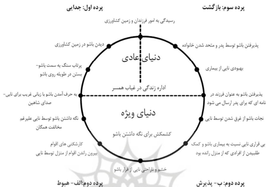
تصویر ۵. چرخه حرکتی سفر قهرمان زن در فیلم باشو غریبه کوچک (نگارندگان)