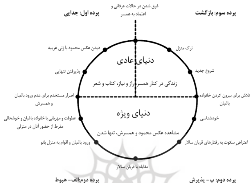
تصویر ۲. چرخه حرکتی سفر قهرمان زن در فیلم بانو (نگارندگان)

۲.۲ فیلم مهمان مامان؛ میهمان مامان ساخته داریوش مهرجویی برگرفته از داستانی به همین نام از هوشنگ مرادی کرمانی است. در آستانه حضور مهمانان در خانه، مادر که قهرمان این داستان است دستپاچه و نگران در تکاپوی تدارک مراسم پذیرایی است. با وجود تلاش های مادر برای آماده کردن هر چه بهتر شرایط، وضعیت آشفته ای حاکم است. پدر هنوز بازنگشته و هر لحظه امکان رسیدن خواهرزاده ی مادر و نوعروسش وجود دارد. با ورود پدر (آقا یدالله) به خانه، مهمانان نیز سر می رسند و این تازه آغاز ماجراست. آقا یدالله برای سرگرم کردن مهمانان، بدون ملاحظه و بی وقفه شروع به تعریف خاطرات خصوصی زندگی اش، برای عروس و داماد می کند و در کنار آن، اصرار او بر ماندن مهمانان، مادر را کلافه کرده، چون در خانه وسیله پذیرایی وجود ندارد. امیر(پسر کوچک خانواده) که با اصرار برای جا به جا کردن ماشین پسرخاله اش بیرون رفته، دیر کرده و خبر می رسد که با ماشین تصادف کرده! صدیقه، زن حامله ای است در همسایگی آنها، که پس از دور ریختن