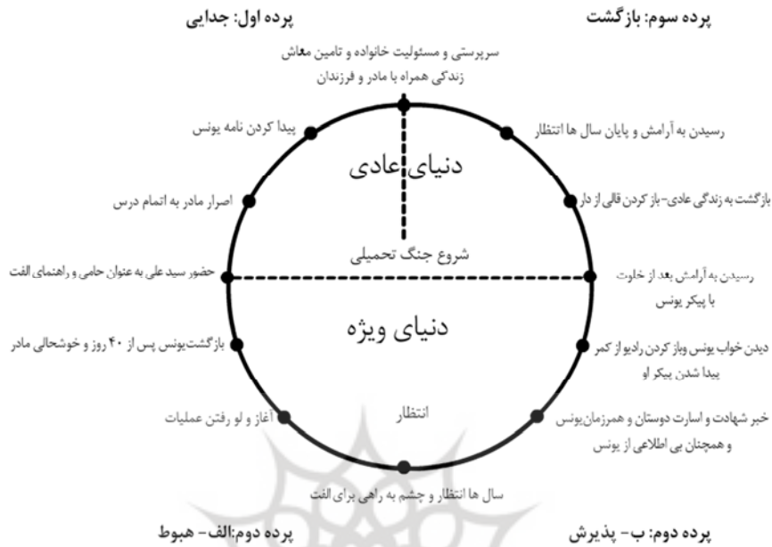
تصویر ۴. چرخه حرکتی سفر قهرمان زن در فیلم شیار ۱۴۳ (نگارندگان)

۴.۲ فیلم باشو غریبه کوچک ؛ باشو غریبه کوچک عنوان فیلمی از بهرام بیضایی است. پس‌ریچه‌ای به نام باشو، هنگام حمله هوایی به شهرش در جنوب ایران، که در آن نابودی خانواده‌اش را به چشم می‌بیند، خود را به کامیونی می‌اندازد و پس از چندی در آن به خواب می‌رود. وقتی چشم باز می‌کند در شمال است، جایی که زبان او را نمی‌فهمند و او زبان محلی را نمی‌فهمد. در این جهان بیگانه زنی به نام نایی جان که دو فرزند دارد و شوهرش به شهری دور به دنبال کار رفته است، او را حمایت می‌کند و در برابر دشمن‌خوئی‌ها و بدگمانی‌های دیگران، سرانجام وی را به فرزندگی می‌پذیرد. باشو خانواده‌اش را در جنگ از دست داده و به دنبال رهایی از جنگ و نابسامانی، سفری ناشناخته را در پیش می‌گیرد و در این مسیر تحول و پختگی را به کمک زنی که در مقام مادر او برمی‌آید طی می‌کند. نایی جان که به نوعی بیانگر «مادر زمین» است و این ارتباط را از طریق تقلید صدای پرندگان آسمان و مرغان زمین نشان می‌دهد در ضمن تبادل