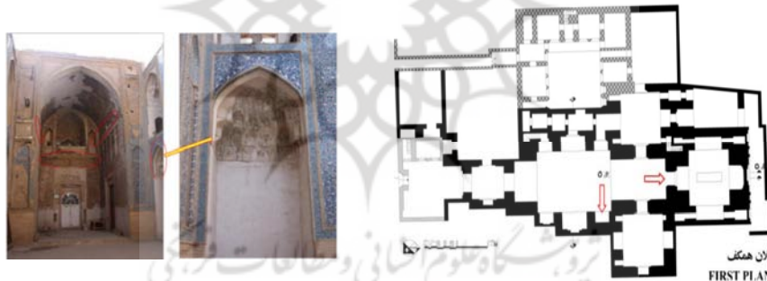
تصویر ۱. پلان و نمای جلوخان ورودی مدرسه شمسیه یزد

در کتاب یادگارهای یزد (افشار، ۱۳۵۴: ۵۹۲-۶۰۴) ذیل مدرسه شمسیه به صندوق تربت سیدشمس‌الدین اشاره گردیده که از عاج و آبنوس ساخته و توسط همسرش به همراه محراب مرمرین از تبریز به یزد فرستاده شد. احتمالاً مقصود از صندوق تربت همان مرقده یا سنگ مزار باشد. سعدی نیز در باب هفتم گلستان حکایت ۱۸ به چنین عبارتی اشاره می‌کند که مقصودش سنگ قبر است (سعدی ۱۳۹۳: ۲۱۷). متن کتیبه‌های موجود در بنا و مشاهده میدانی تزئینات بنا (تنوع، نوع تزئینات و مصالح به کار رفته) نشان از توجه این خواص این دوره به هنر و معماری است (تصویر ۱).