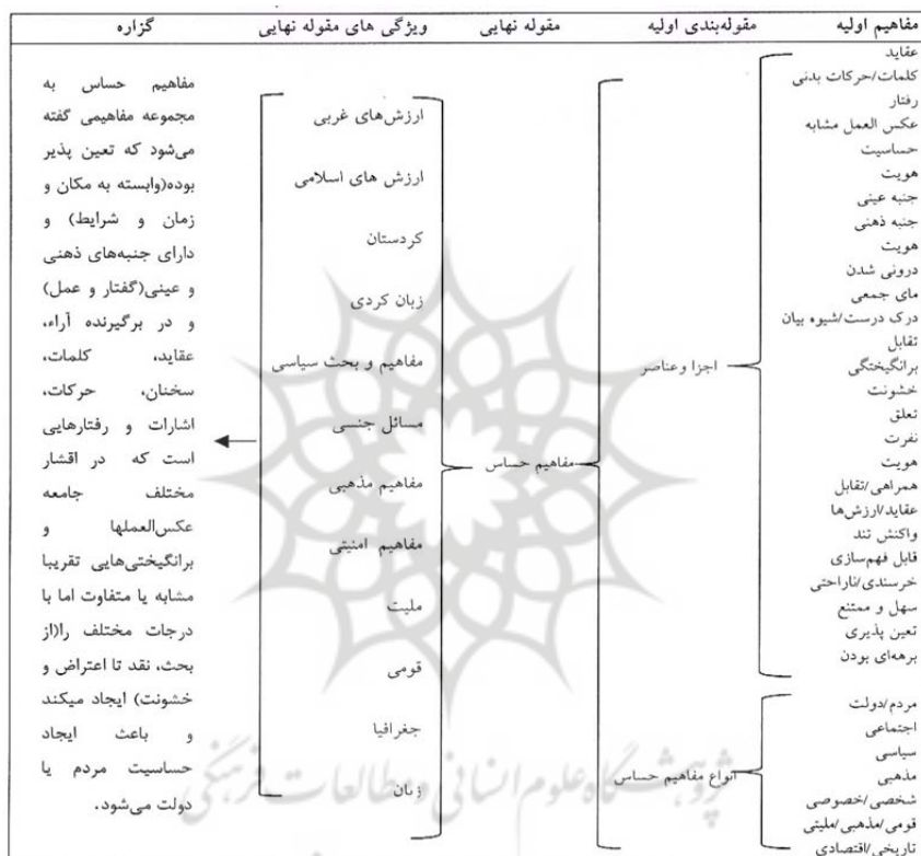
نمودار ۲. مراحل شکل‌گیری گزاره دوم

ایجاد کنند و از طریق فرایندهایی مانند هنجارها، ارزشها، عقاید، امور مقدس تاثیرگذاری بیشتری را داشته باشند. مهمترین ویژگی‌های مفاهیم حساس این است که دوجبهی هستند؛ یعنی هم از دید مردم و در عین حال دولت‌ها حساس هستند. همچنین تابع زمان، شرایط و دیدگاه‌های مختلف موجود در جامعه و دولت‌ها و نیز ایجاد نابرابری و تبعیض در جامعه هستند.