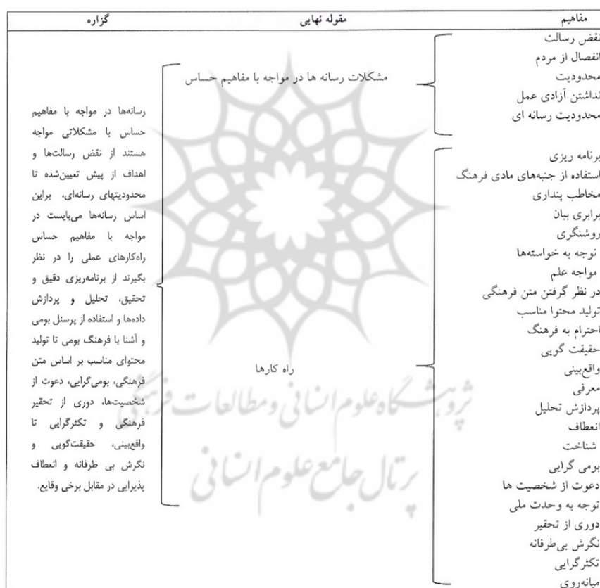
نمودار ۳. مراحل شکل‌گیری گزاره سوم

تقریباً مشابه یا متفاوت اما با درجات مختلف را (از بحث، نقد تا اعتراض و خشونت) ایجاد میکند و باعث ایجاد حساسیت مردم یا دولتمه کاربرد یا نوع کاربرد و استفاده از آنها می‌شود. مفاهیم حساس دارای انواعی می‌باشند مانند؛ قومی، تاریخی، مذهبی، سیاسی، اقتصادی، اجتماعی، شخصی یا عمومی. از جمله مهم‌ترین مفاهیم حساس که در استاد کردستان، چه در بین مردم و چه در بین مسئولین، نسبت به آنها حساسیت وجود دارد عبارتند از: ارزش‌های غربی، ارزش‌های اسلامی، کردستان، زبان کردی، مفاهیم و بحث سیاسی، مفاهیم مذهبی، مفاهیم امنیتی، ملیت، قومیت، زبان و لهجه، پوشش، مسائل خانوادگی، مسائل زنان، پوشش، فساد.