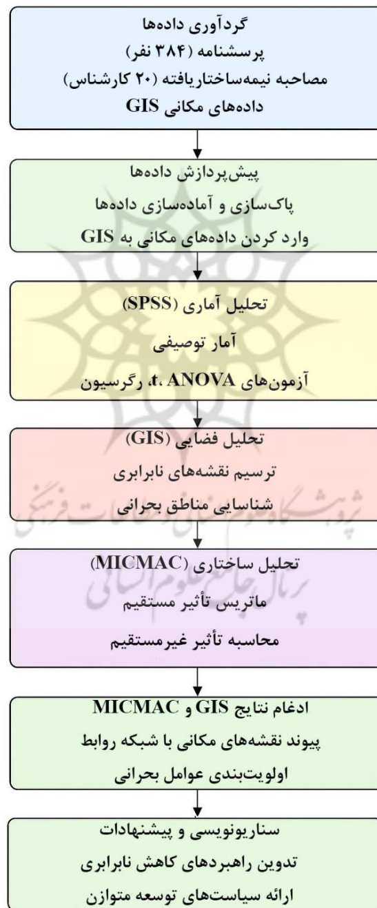
شکل ۱. فرآیند اجرای پژوهش با رویکرد ترکیبی GIS-MICMAC