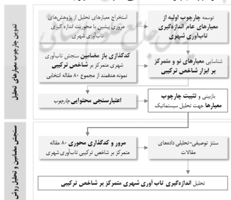
شکل ۲. روند تدوین چهارچوب تحلیلی جهت مرور سیستماتیک مقالات

پژوهش حاضر عناصر حاصل از مرور چهارچوب‌محور و تحلیل تماتیک استقرایی را در راستای بهره‌گیری از دانش تثبیت‌شده پیشین در عین حفظ انعطاف‌پذیری لازم برای شناسایی مفاهیم نوظهور تلفیق کرده است. این فرایند در مراحل متوالی و بازبینی‌شونده مطابق شکل ۲ به اجرا درآمد و چهارچوب تحلیلی جهت مرور سیستماتیک مقالات تدوین گردید (جدول ۲).