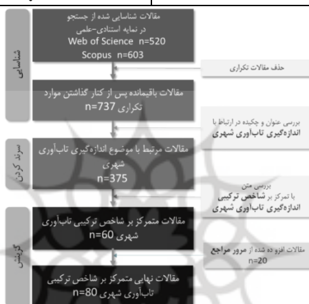
شکل ۱. روند گزینش مقالات