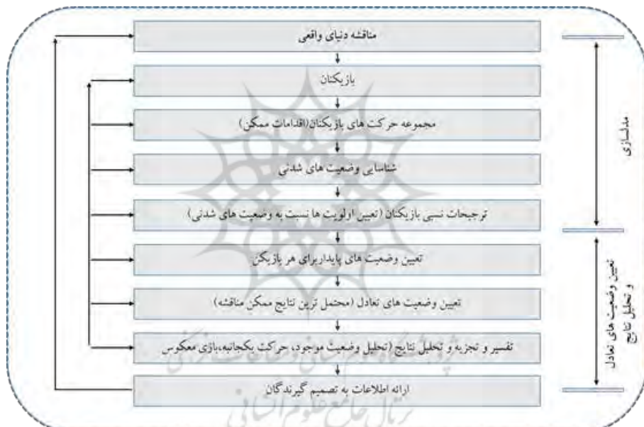
شکل ۱. فرایند مدل‌سازی و تجزیه و تحلیل در مدل‌های گراف

تعادل میان بازیگران در حوزه سرمایه‌گذاری و تأمین مالی صنعت پتروشیمی ایران، به دلیل ماهیت پیچیده و چندوجهی آن، نیازمند رویکردهای تحلیلی ساختاریافته است. مدل گراف در نظریه بازی‌ها، به‌عنوان ابزاری کارآمد در تحلیل تعارضات چند بازیگری، به‌ویژه در شرایطی که ترجیحات بازیگران قابل‌اندازه‌گیری دقیق نیست، مورد استفاده قرار می‌گیرد (Fang et al., 2003; Rosenhead & Mingers, 1989; Wang et al., 2018; Kilgour & Hipel, 2010).