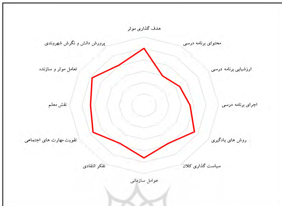
نمودار راداری ۱: رتبه‌بندی کدهای انتخابی الگوی ویژگی‌های برنامه درسی تربیت شهروندی