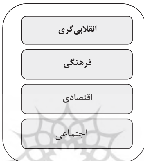
جدول (۷): مدل مفهومی تحقیق