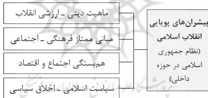
جدول شماره: (۱) عناصر مفهومی تحقیق

با توجه به مرور ادبیات تحقیق، می‌توان چهار بُعد ماهیت انقلابی، مبانی ممتاز فرهنگی و اجتماعی، اجتماع و اقتصاد، سیاست اسلامی و دینی را به‌عنوان ابعاد برجسته ماهیت فرهنگی و اجتماعی انقلاب اسلامی انتخاب کرد.