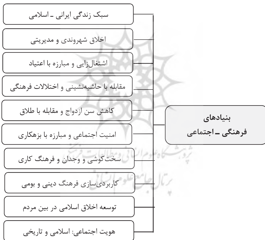
جدول شماره (۳): مؤلفه و شاخص‌های فرهنگی - اجتماعی

اهمیت و تأثیرگذاری فرهنگ در تحقق و تداوم انقلاب اسلامی و همچنین جایگاه رفیع آن نزد رهبران انقلاب از نکاتی است که بر هیچ‌کس پوشیده نیست؛ به‌طوری‌که حضرت امام علیه السلام انقلاب اسلامی را یک انقلاب فرهنگی معرفی کرده و مقام معظم رهبری مسئله فرهنگ را یک مسئله حیاتی برای کشور دانسته و بر مدیریت فرهنگی و مهندسی فرهنگ و پرداختن جدی به مقوله فرهنگ به‌عنوان اولویت اول کشور تأکید کرده‌اند. برای استحکام فرهنگی کشور وجود عناصر و مؤلفه‌هایی ضرورت دارد که در شکل (۳) به این عناصر پرداخته شده است.