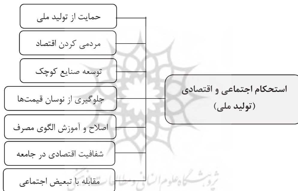
جدول شماره (۴): مؤلفه و شاخص‌های اجتماع و اقتصاد

مهم و تأثیرگذار در رشد و توسعه صنعتی کشورها است. این کالا بعد از نفت و گاز، دومین کالای پر حجم در تجارت جهانی است. طبق آمار انجمن فولاد، کمتر از ۷۰ کشور در زمینه تولید فولاد فعال هستند و کشورهای بی بهره از این صنعت یا باید از پیشرفت چشم‌پوشی کنند و یا باید به کشورهای تولیدکننده وابسته شوند. پس از انقلاب اسلامی تولید فولاد ایران ۱۸ برابر متوسط جهانی بوده است که جهش شگفت‌انگیز این محصول راهبردی را نشان می‌دهد (انجمن جهانی فولاد، ۲۰۱۷)؛ به نقل از قیومی‌پور، (۱۳۹۷: ۵۱). آنچه در بیان امام خمینی علیه السلام ، خودکفایی و استقلال اقتصادی نامیده شده است، در زبان رهبر معظم انقلاب اسلامی (مدظله العالی)، به «اقتصاد مقاومتی» نام نهاده شد. مؤلفه‌های اقتصاد مقاومتی به‌عنوان بسته استحکام‌بخش بعد اقتصادی ایران در شکل زیر نشان داده شده است.